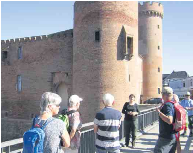
Vor der Burg