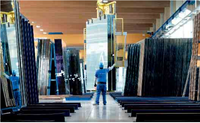
In der Flachglasbranche gibt es spannende Ausbildungsmöglichkeiten.

sionsreduktion kommen nicht zu kurz. Anschließend verantwortet man eigene Projekte, verwirklicht kundenindividuelle Produktanforderungen und sorgt für eine optimale Materialwirtschaft innerhalb des Unternehmens. (BF/FS)