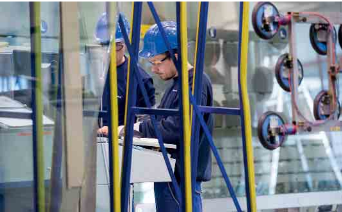
In der Flachglasbranche gibt es spannende Ausbildungsmöglichkeiten.

zum Flachglas-technologe beziehungsweise -technologin. Danach ist man Profi darin, mit computergesteuerten Maschinen Autoscheiben, Isolierglas für Fenster oder gläserne Platten für Tische, Türen und Vitrinen zu fertigen. Die Glasveredelung, beispielsweise von Spiegeln oder Sicherheitsgläsern, ist ein weiterer Schwerpunkt dieses Berufes, für den die Bewerber