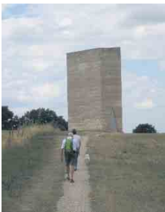
Bruder Klaus Kapelle

Am 23. August erkundete der Heimat- und Geschichtsverein zunächst das schöne Städtchen Zülpich, gelegen in der gleichnamigen Börde am Fuße der Eifel. 16 „Ausflügler“ waren zu dieser Exkursion mit PKW unterwegs. Zunächst brachte uns unsere Stadtführerin die wechselhafte Geschichte der Stadt von Chlodwig bis zur Bombardierung im 2. Weltkrieg auf humorvolle Weise nahe. So lernten wir die spannungsgeladenen Beziehungen der vier großen Karnevalsvereine