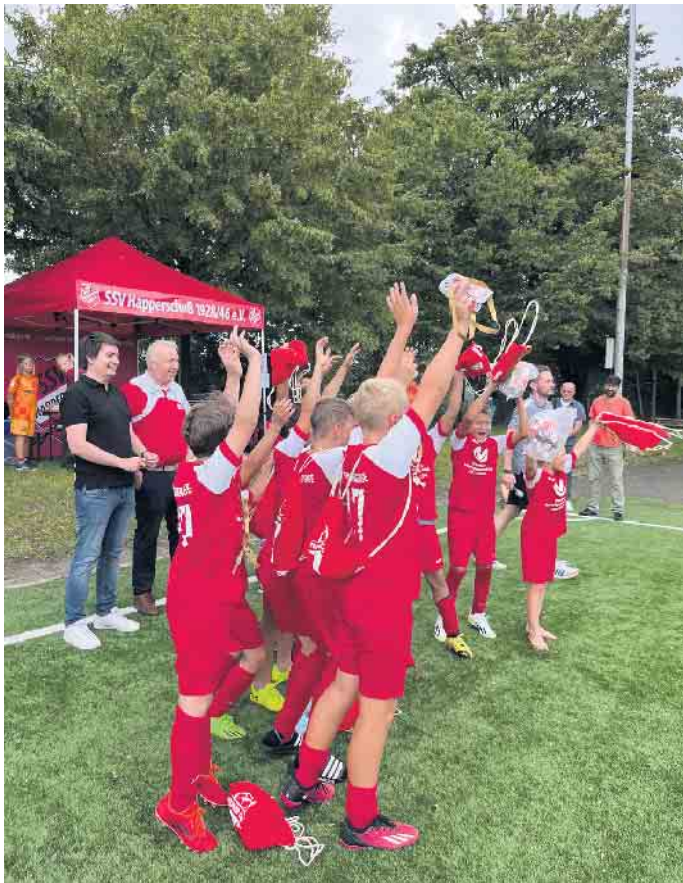
Sportwoche beim SSV Happerschoß

Am Wochenende vom 11. bis 13. August fand die diesjährige Sportwoche beim SSV Happerschoß statt. Der Freitag startete wie gewohnt mit dem Alte-Herren-Turnier, bei dem dieses Jahr ein sehr starkes Teilnehmerfeld bestehend aus sieben Mannschaften teilgenommen hat. Der Samstag und Sonntag waren ganz im Sinne der Fußball-Jugend. Mit ca. 600 Kindern und Jugendlichen waren die Turniere an beiden Tagen bestens besetzt und bei größtenteils schönem Wetter