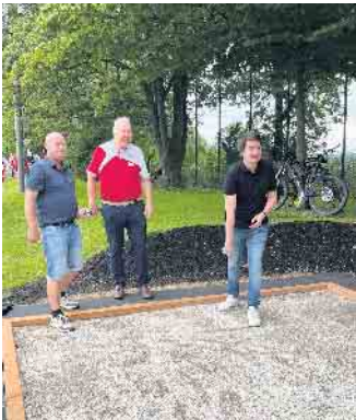
Einweihung der Boulebahn

Am Wochenende vom 11. bis 13. August fand die diesjährige Sportwoche beim SSV Happerschoß statt. Der Freitag startete wie gewohnt mit dem Alte-Herren-Turnier, bei dem dieses Jahr ein sehr starkes Teilnehmerfeld bestehend aus sieben Mannschaften teilgenommen hat. Der Samstag und Sonntag waren ganz im Sinne der Fußball-Jugend. Mit ca. 600 Kindern und Jugendlichen waren die Turniere an beiden Tagen bestens besetzt und bei größtenteils schönem Wetter