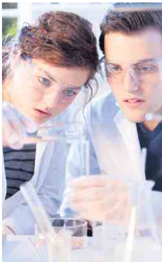
Im Programm „StartPlus“ werden junge Menschen mit Startschwierigkeiten beim Start in eine qualifizierte Ausbildung unterstützt.

das Schließen schulischer Lücken mit einer praxisorientierten Berufsorientierung verbindet Gute Chancen auch bei Startschwierigkeiten Der Clou dabei: Die Jugendlichen beginnen das Programm, ohne zu wissen, welcher Ausbildungsberuf dabei herauskommt. So können sie sich ausprobieren und herausfinden, was ihnen liegt: eher das technische oder elektrotechnische Umfeld, das Handwerk, die Mechanikerberufe, das Labor? Oder wie sieht es aus mit Chemikant oder Pharmakant? Wer das StartPlus-Programm erfolgreich absolviert, auf den wartet ein passender Ausbildungsplatz. Und die Erfolgsquote ist hoch: In den vergangenen zehn Jahren haben im Schnitt neun von zehn Teilnehmenden nach Abschluss des Projekts eine Ausbildung im Unternehmen begonnen. (djd)