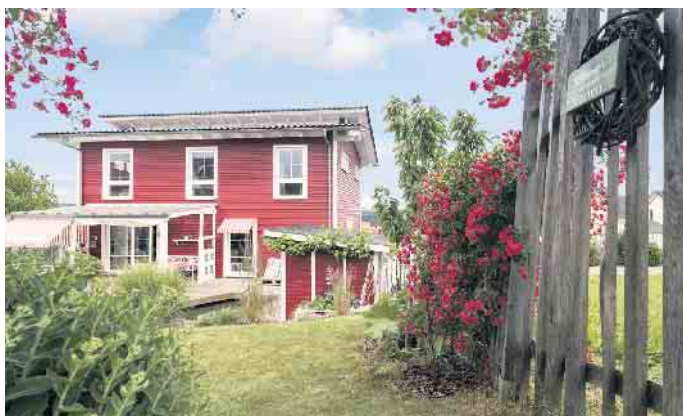
Wohlfühlwohnen gelingt in einem individuell geplanten Holz-Fertighaus sicher.

Die Gestaltungsmöglichkeiten dabei sind unzählbar: von der Architektur über den Grundriss bis hin zur Ausstattung wird alles individu-