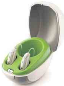
Phonak Audéo™ Paradise

Jetzt Termin vereinbaren und unverbindlich Probe tragen!