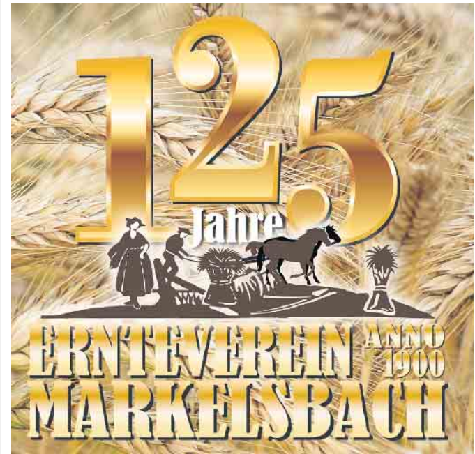
125-jähriges Jubiläumslogo (Grafik W. Twardy)

125-jähriges Jubiläums-Erntefest vom 22.08. bis 24.08.2025 in Markelsbach