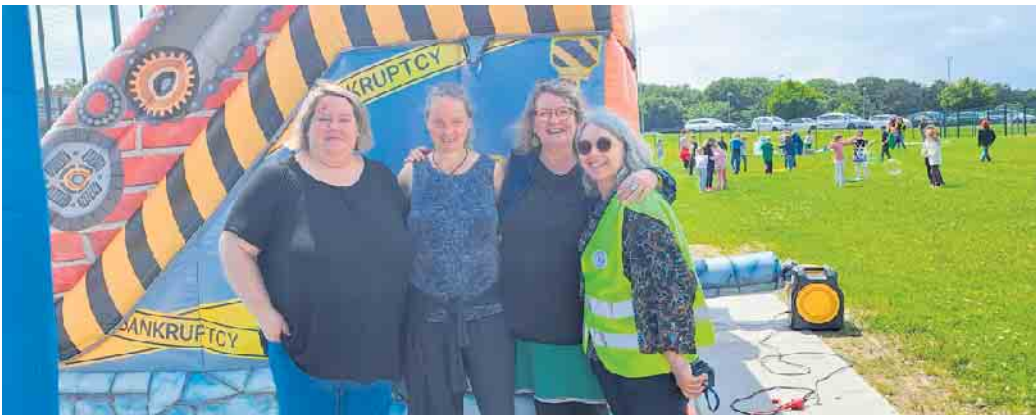
Vertreterinnen der Schule und des Kinderschutzbundes vor der Hüpfburg