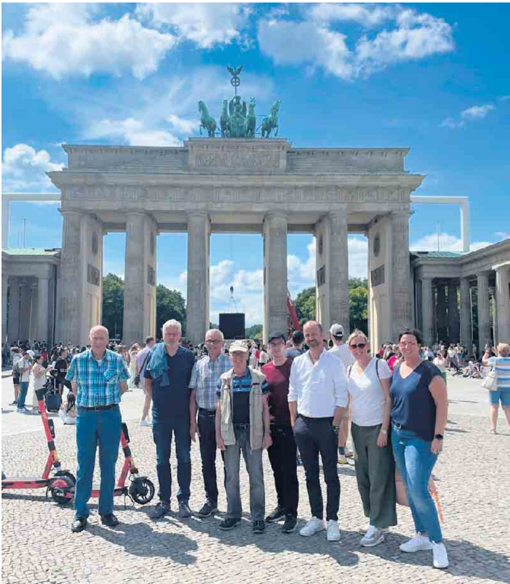
Vor dem Brandenburger Tor