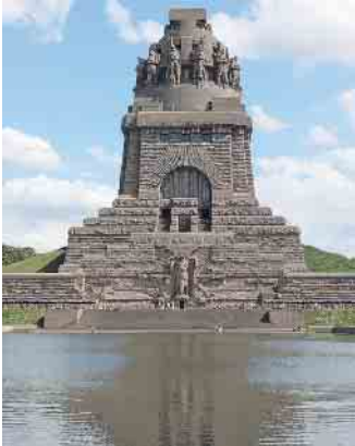
Völkerschlachtdenkmal von 1931

Freundeskreis Buch und Kunst Neunkirchen-Seelscheid e.V.