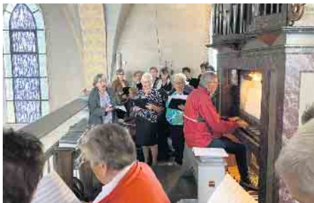
Rund um die Hermerather Orgel fanden alle Neunkirchner Sänger ein passendes Plätzchen.

Die Kirchenchöre im Pfarrverband Neunkirchen-Seelscheid sehen sich Gott sei dank nicht als Konkurrenz an, sondern unterstützen und helfen sich gegenseitig, wann immer es nötig ist. So war es auch kein Problem, dass der Hermerather Kirchenchor ausgerechnet zur „Hermedder Rötsch“, dem Patronatsfest der Kirche St. Anna, verhindert war. Eine Anfrage genügte, und die Neunkirchner Sängerinnen und Sänger versprachen einzuspringen. Auch der frühe Messtermin schreckte die Neunkirchner nicht ab. Sie kamen sogar noch eine halbe Stunde früher und eingedenk der Enge auf der Orgelempore in kleinerer Besetzung. Nach einer kurzen Stellprobe hatte jede und jeder rund um die Orgel einen Platz gefunden. Zur Feier