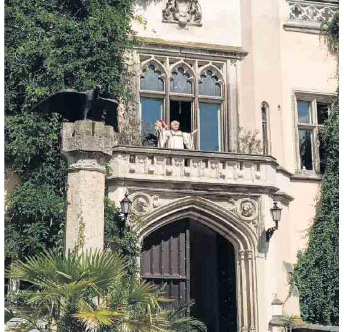
Die Schlossherrin spricht zu uns.

nen. Max Klingers monumentale Beethoven-Skulptur im Museumseingang und Werke von Liebermann, Corinth, Kokoschka, Beckmann u. a. konnten dort bestaunt werden. Im Grassimuseum gruppieren sich die drei Grassammlungen Angewandte Kunst, Völkerkunde und Musikinstrumente mit ihren Ausstellungsräumen um zwei grüne Innenhöfe. Auch die Geschichte kam während dieser Woche nicht zu kurz. 1913 wurde das riesige Völkerschlachtdenkmal eingeweiht. Im Denkmal dokumentiert eine Ausstellung die Baugeschichte. Beeindruckend war der Blick von der 91 m hohen Aussichtsplattform. Im Museum in der „Runden Ecke“ konnten die Besucher den Schrecken der SED-Diktatur hautnah erleben. Ein Orgelkonzert in der Thomaskirche und eine Orgel-Vesper in der Nikolaikirche sowie eine Führung im Bach-Museum ließen unsere Herzen höher schlagen. Auch im Leipziger Umland gab es viel zu entdecken. In der Stadt Wurzen mit ihren Renaissance- und Barockgebäuden erhielten die Freunde von Buch und