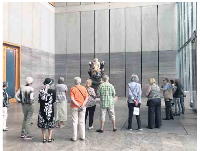
Museum der Bildenden Künste: Beethoven Skulptur