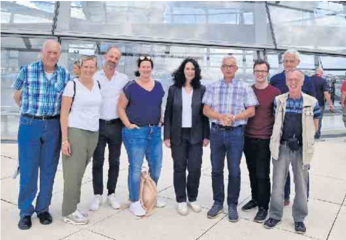
Vor der Reichstagskuppel