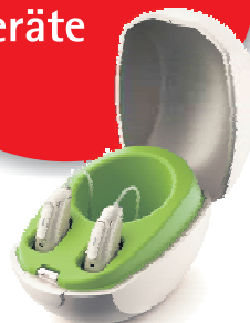
Phonak Audéo™ Paradise