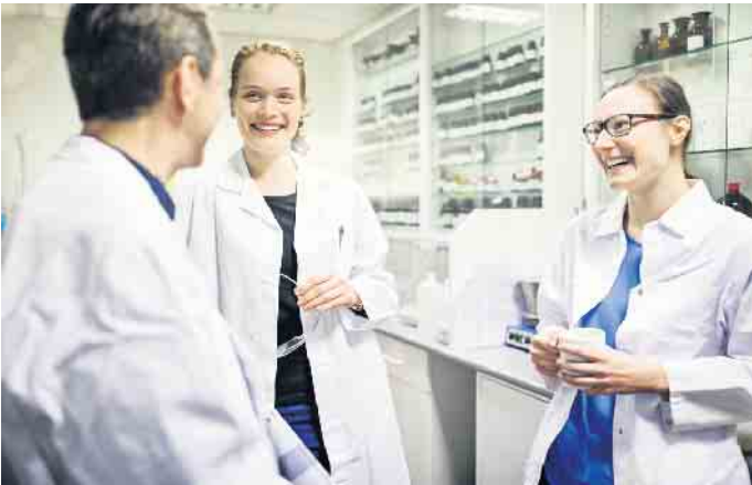
Teamarbeit und abwechslungsreiche Aufgaben machen den Beruf des pharmazeutisch-technischen Assistenten so interessant.

sollte mindestens einen Real- schulabschluss mitbringen sowie Interesse an Naturwissenschaften wie Biologie, Chemie und Botanik. Ebenso sind Einfühlungsvermögen und ein kommunikatives Wesen gefragt. Die Ausbildung erfolgt über zwei Jahre an einer Schule mit anschließendem halbjährigem Praktikum in einer Apotheke. Unter www.linda.de findet man