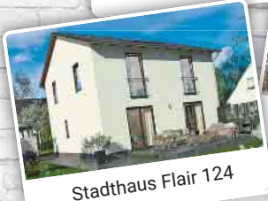
Stadthaus Flair 124