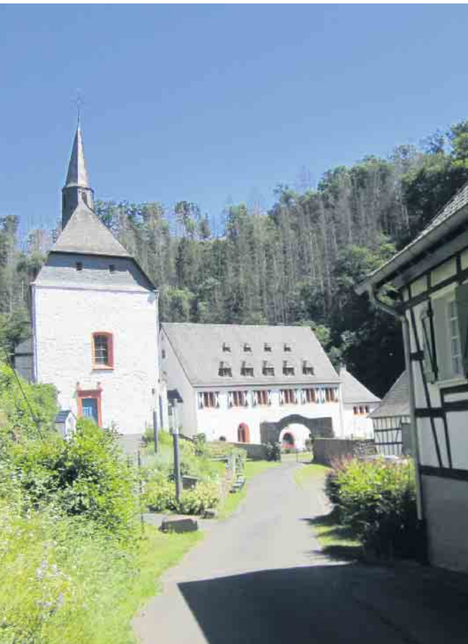
Kloster und Kirche