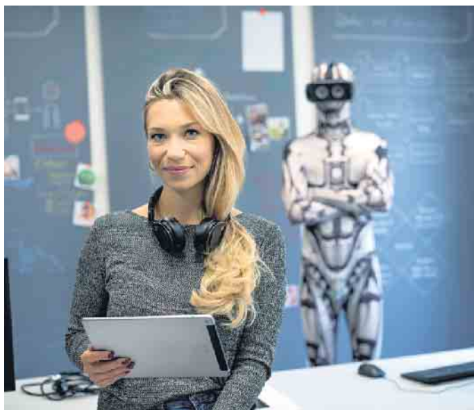
Im Master-Studiengang kann man zur Digital-Expertin werden.