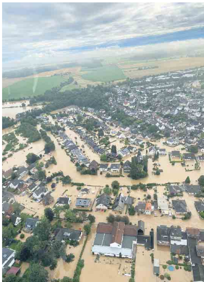
Flutgebiet in Swistal-Heimerzheim.