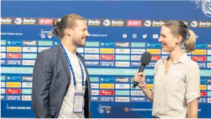
Reporter und Journalisten sind ganz nah dran an den wichtigen Leuten des Sportbusiness. Hier ist die richtige Kommunikation ausschlaggebend.