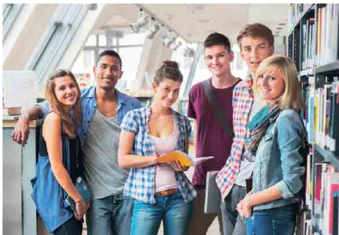
Bei der BG ETEM gibt es viele interessante Ausbildungsmöglichkeiten - von der Hotelfachkraft bis zum dualen Studium.