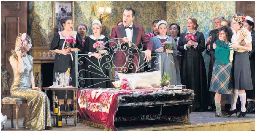
Szene aus „Figaros Hochzeit“ - Inszenierung von 2018.

Bequem und bei jedem Wetter einfach mit dem Bus ins Theater - klingt zu gut, um wahr zu sein?