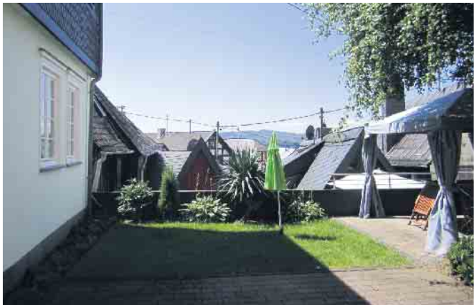
Die Dächer von Hachenburg