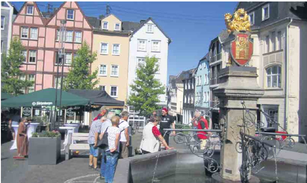
Alter Markt mit Brunnen