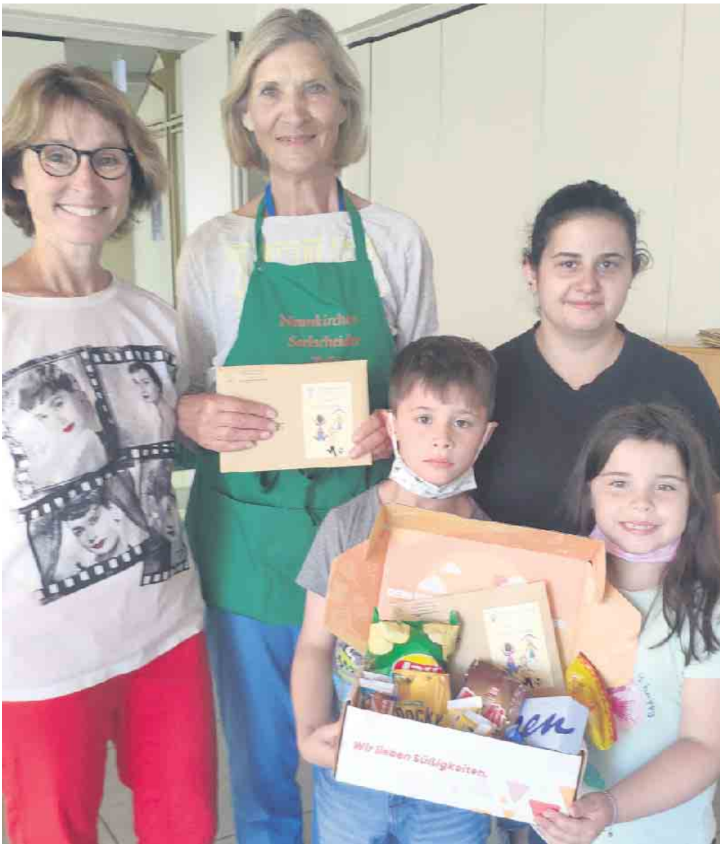
Strahlende Augen bei der Gutschein-Übergabe