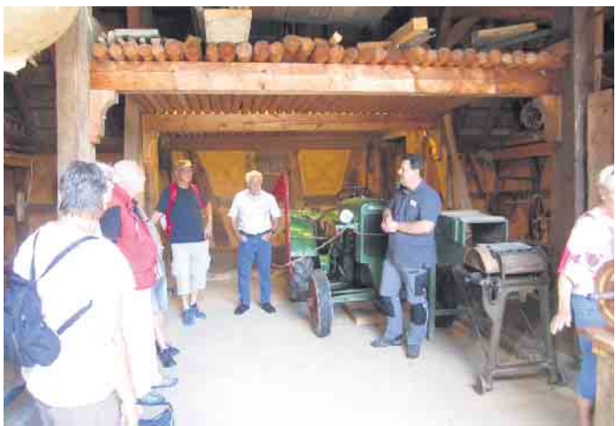
Alte Scheune im Museum

gebiet Oberheister Bitzen geben. Der Kartenvorverkauf startet am 11. September im Rahmen der Leistungsschau „Seelscheider Sommer“. Also bereits jetzt den Termin für dieses tolle Event vormerken.