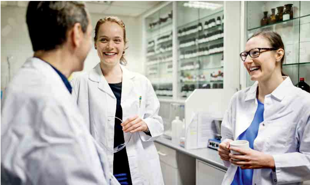
Teamarbeit und abwechslungsreiche Aufgaben machen den Beruf des pharmazeutisch-technischen Assistenten so interessant.