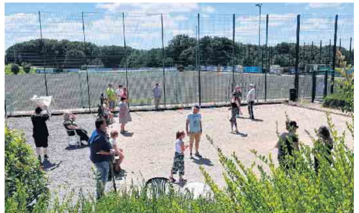
Familientag in Breitscheid

Angeboten wird die Einführung in den nächsten Wochen jeweils mittwochs und freitags ab 16 Uhr auf dem Sportgelände Breitscheid. Spielmaterial kann vom