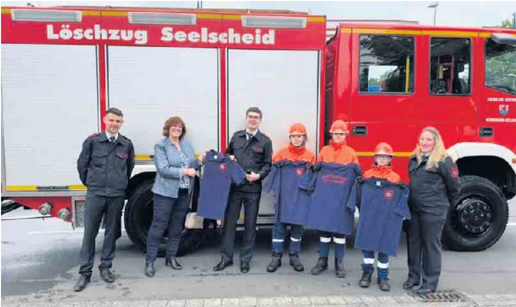
Übergabe der Polohemden