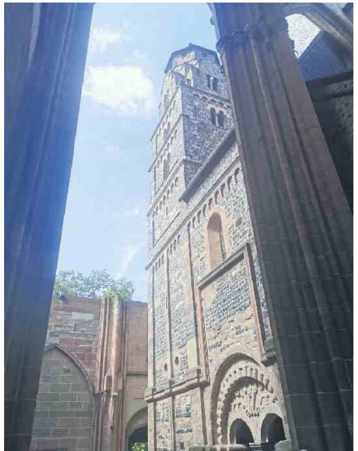
Der unvollendete Dom in Wetzlar