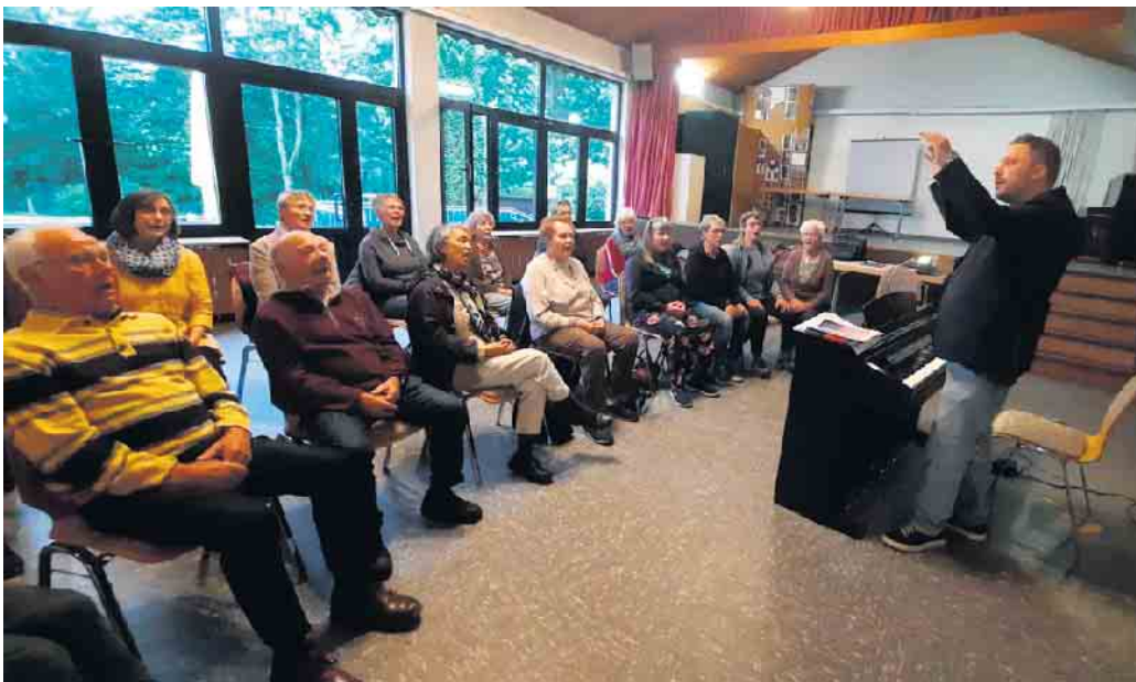
Probe der Chorgemeinschaft mit dem neuen Dirigenten.