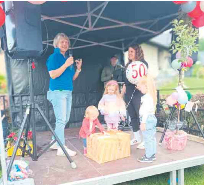
50 Jahre werden ausgiebig gefeiert.

Kinderschutzbund gratuliert zum 50. Jubiläum - Initiative Kindergarten e. V. Pohlhausen feiert mit einem Straßenfest