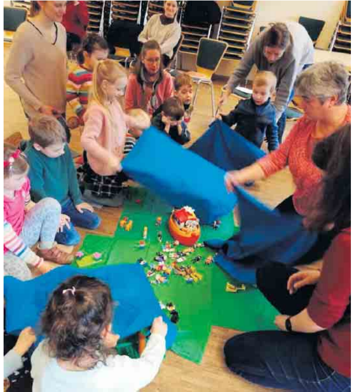
Geschichten werden gespielt