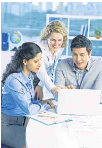
Motivierte und gut ausgebildete junge Menschen erwarten bei ihrem künftigen Arbeitgeber nicht nur ein schönes Gehalt und gute Karrierechancen - auch das Drumherum muss stimmen.

Umfrage der Gesellschaft für Konsumforschung (GfK) im Auftrag der Allianz unter Schülern und Studenten nachgegangen. Freiwillige Gesundheitsleistungen beeinflussen Arbeitgeberwahl Ein üppiges Gehalt und die