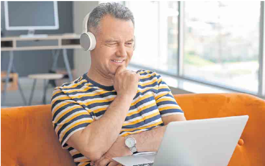
Weiterbildungsangebote aus dem Bereich Energie und Umwelt richten sich sowohl an Arbeitssuchende als auch an Berufstätige, die mehr Verantwortung in ihrem Unternehmen übernehmen und an einer nachhaltigen Zukunft mitwirken wollen.

Das Institut für Berufliche Bildung (IBB) beispielsweise, einer der