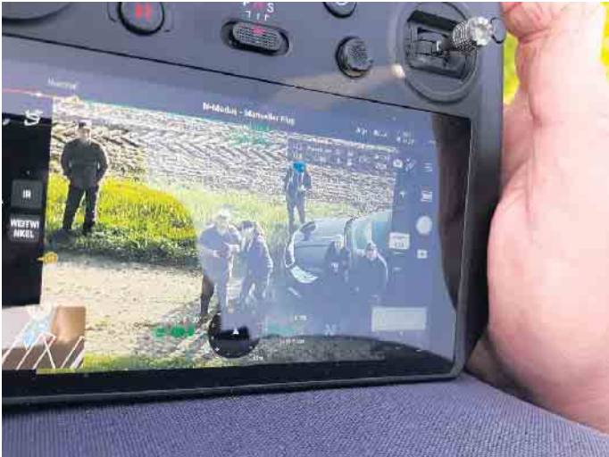
Die derzeit aktiven Drohnenpiloten

flügen sein kann, dass wir schon mal nahe an den Grundstücken vorbeifliegen müssen. Allerdings liegt unser Fokus dabei nur auf der Wiese und keinesfalls auf Euch oder Eurem Hab und Gut. Gerne dürft Ihr uns bei unserer ehrenamtlichen Arbeit über die Schulter schauen und uns Fragen stellen. Möchtet Ihr ein Teil von Wildschutz Rheinland e. V. werden? Über aktive Hilfe und Unterstützung bei den umfangreichen Sicherungs- und Bergungstätigkeiten freuen wir uns ebenso wie über weitere Drohnen-Piloten mit entsprechender Lizenz. Auch mit jeder Spende für eine weitere entsprechende Drohne oder Mitgliedschaft trägt Ihr dazu bei, Rehkitze und andere Wildtiere zu schützen. Der Verein ist seit Mitte 2024 als gemeinnützig an-