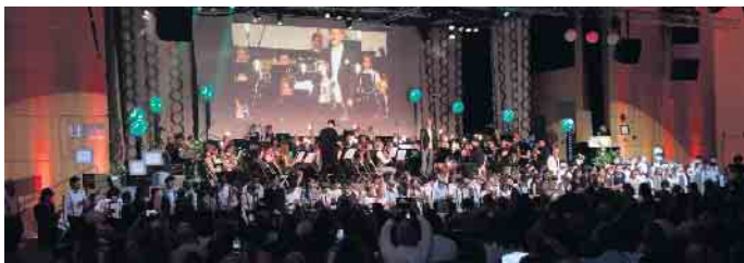
Am Ende sangen alle Künstler*innen gemeinsam mit dem Publikum die „Irischen Segenswünsche“ und schlossen den Abend in herzlicher Gemeinschaft ab.

Diese führten vor einer aufwendig geschmückten Bühne durch die musikalischen und historischen Kontexte der 20er-Jahre. Sie gewährten Einblicke in die Veränderungen der damaligen Zeit, von restriktiven Protesten über den wirtschaftlichen Aufschwung durch die Rentenmark bis hin zu ikonischen Schwarz-Weiß-Filmen. Den musikalischen Auftakt machte das JBO mit der majestätischen „Jupiter Hymne“, gefolgt von dem imposanten Stück „Mont Blanc“. Das SBO setzte den Abend fort mit der „Kleinen Dreigroschenmusik“, der Ouvertüre zur Oper „Porgy and Bess“ und einer eindrucksvollen Darstellung von „Chaplin“, untermauert von faszinierenden Kurzfilmen, die die Stimmung der Zeit bestens einfingen. Im zweiten Teil des Konzerts zeigten die Bläserklassen 5b und 6b mit Hits wie „Señorita“ und „Libertango“ ihr Können. Höhepunkte des