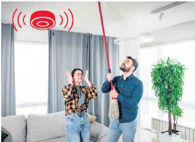
Sollten Rauchmelder einmal unerwünscht piepen, ist es hilfreich, wenn die Geräte mit einem Stummschaltknopf ausgestattet sind. Im Optimalfall ist der so groß, dass er sich bequem vom Boden aus erreichen lässt.