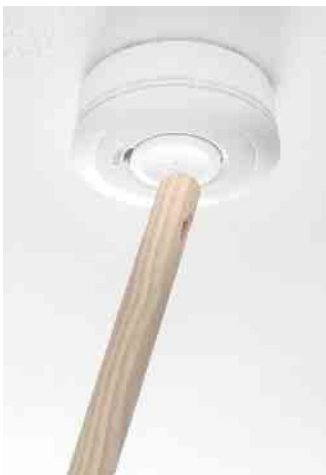
Ein großer Stummschaltknopf bei Rauchmeldern erleichtert das temporäre Deaktivieren des Signals ohne Leiter.

Wichtig zum Vermeiden von Fehllalarmen ist, dass die Installation der Rauchmelder in den richtigen