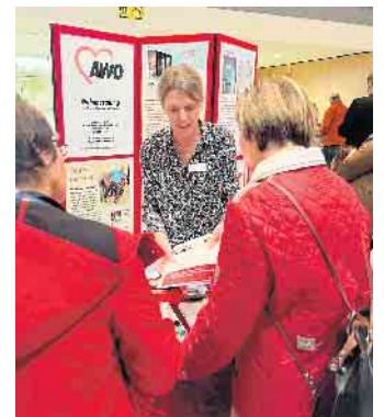
Impressionen Seniorenmesse 2023

und für Ruppichterorth: sim@ruppichterorth.de .