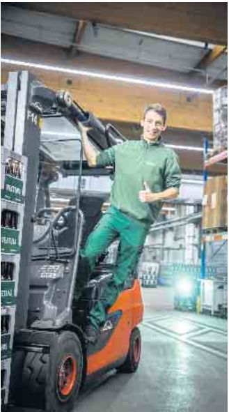
Der innerbetriebliche Transport erfolgt mit modernen Flurfördermitteln, die eingesetzten Gabelstapler können sechs Paletten gleichzeitig transportieren.

Genauigkeit, Verantwortungs- und Gefahrenbewusstsein sowie eine hohe Einsatzbereitschaft. (DJD)