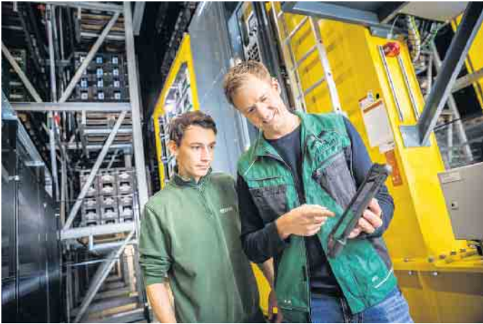
Die Ausbildung zur Fachkraft für Lagerlogistik in der Brauerei dauert drei Jahre, Voraussetzung ist ein Hauptschulabschluss.

Bei der Brauerei C. & A. Veltins beispielsweise finden Auszubil-