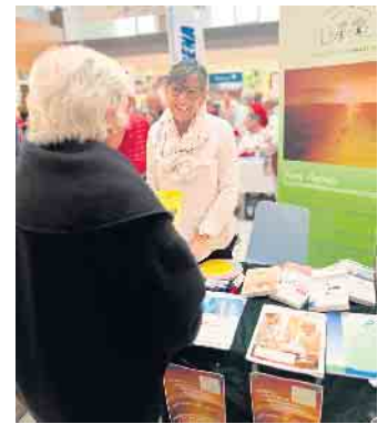
Impressionen Seniorenmesse 2023