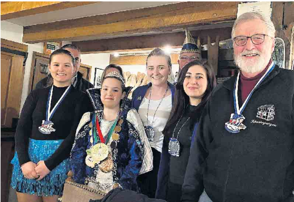
Besuch der KG mit der Prinzessin

Es hat ihnen wieder viel Spaß und Freude gemacht, an diesem familiären Weihnachtsmarkt teilzunehmen. Erfreut waren sie auch darüber, eine ordentliche Summe Geld für die Kinder und Jugendarbeit übergeben zu können, nämlich 900 Euro, zu gleichen Teilen der „KG für uns Pänz“, der ökumenischen Aktion „+Zeit für Kids“ und dem Spendenkonto des Arbeitskreises „Seelscheider Chresmaat“ bei der Katholischen Kirche in Seelscheid.