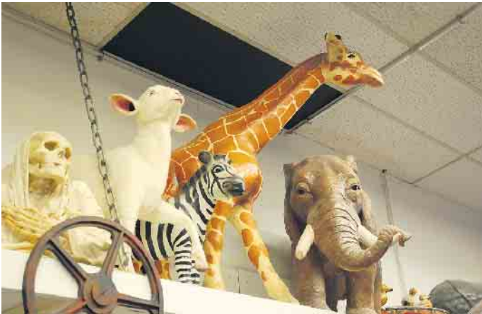
Besuch in den Theaterwerkstätten beim Theaterspaziergang 2022.

meinde Bonn, Elisabeth Einecke-Klöveborn) Vergabe der Plätze nach Reihenfolge der Anmeldungen, max. 40 Personen. Anmeldungen bitte schriftlich: per Mail - info@tg-bonn.de oder per Post an: Theatergemeinde Bonn, Bonner Talweg 10, 53113 Bonn