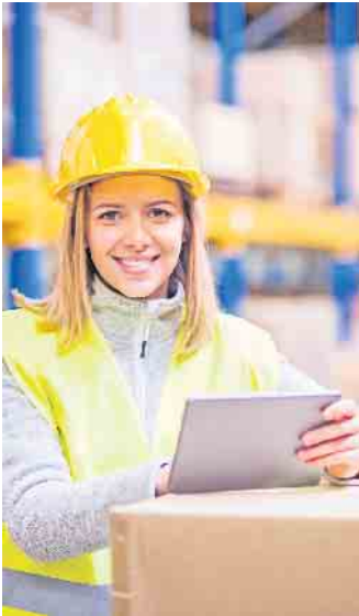
Glücklich im neuen Job: Eine Umschulung eröffnet langfristig berufliche Perspektiven. Den Weg zum Abschluss muss man nicht alleine beschreiten.

Für sie bietet das IBB sogenannte umschulungsbegleitende Hilfen in Form von zusätzlichem Fachunterricht, der auf die Bedürfnisse und den Umschulungsberuf der Teilnehmer abgestimmt ist. Damit wird Umschülern in Betrieben ermöglicht, ihre Ausbildung erfolgreich zu beenden und langfristig in den Arbeitsmarkt integriert zu werden. (djd)