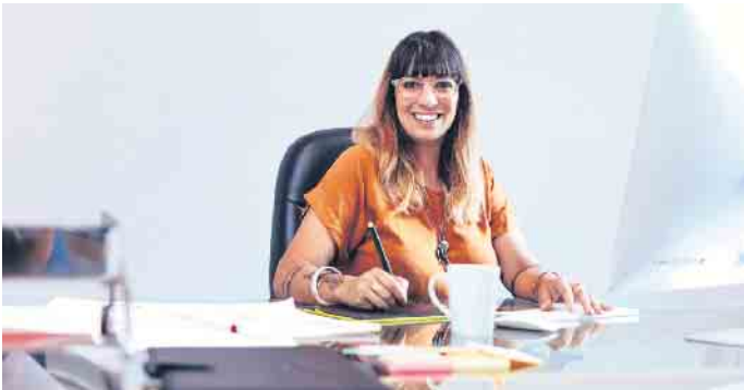
Eine Umschulung in einen anderen Beruf bringt Chancen, aber auch Herausforderungen mit sich.