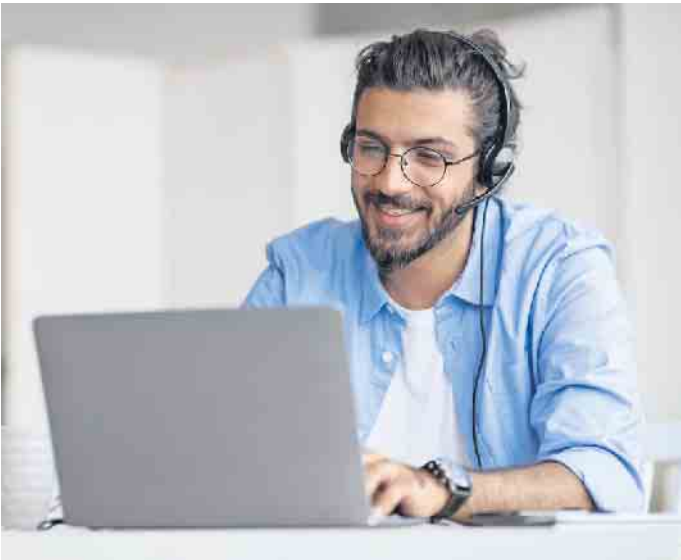
Die Umschulung in einen anderen Beruf kann aus verschiedenen Gründen notwendig werden. Für viele bedeutet eine solche Neuorientierung auch eine große Herausforderung.

Gut gerüstet in die Prüfung dank zusätzlicher Begleitung Auch Umschüler in Unternehmen benötigen manchmal Unterstützung, um etwa mit den hohen Leistungsanforderungen in der Berufsschule zurechtzukommen und ihre Prüfungen zu bestehen.