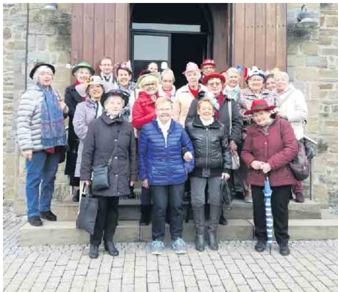
Nach der Messe stellten wir uns am Eingang für ein Foto auf.

Das war für Herr Röttig ein Anlass, die Messe mit Karnevalsliedern einzustimmen und sang auf Kölsch kräftig mit. Alle Frauen möchten Herrn Röttig herzlich danken für die kölschen Lieder und wir haben alle kräftig mitgesungen.