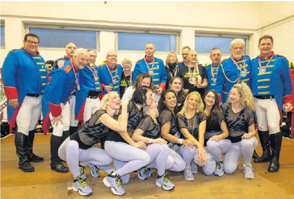
Dorfgrrenadiere Birkenfeld und Danza Colada „on Tour“

Eine super Session, mit 55 Auftritten und einer Fahrstrecke von 1.126 km ist vorüber. Wir waren auf kleinen und großen Bühnen zu sehen... Ob traditionell im Kindergarten Birkenfeld, in Köln, Bonn oder Essen, das Publikum war überall einfach toll. Auch bei uns in Seelscheid sind wir immer wieder herzlich willkommen. Ganz besonders war für uns dieses Jahr unser Auftritt im Ahr-