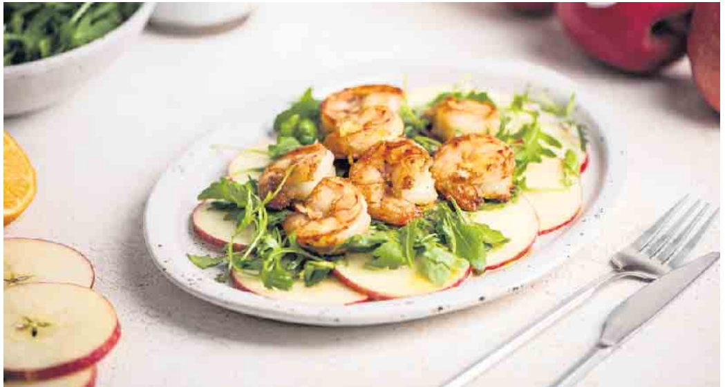
Äpfel, Rucola und Riesengarnelen sind eine zauberhaft einfache Kombi für die gesunde Küche.