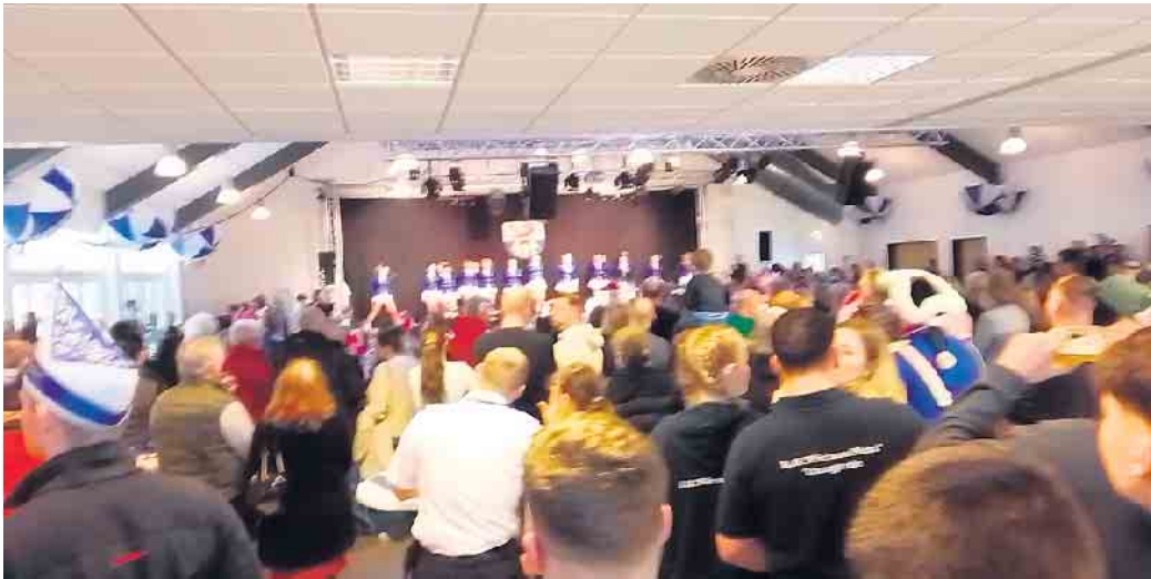
Volles Haus beim Gardetreffen der K. G. „Für uns Pänz“ Seelscheid

Am 16. Februar veranstaltete die K.G. „Für uns Pänz“ Seelscheid ein Gardetreffen. Neben den eigenen Garden - Bambini, Kinder-, Junioren- und Seniorengarde - traten die KG Närrische Brückenwache e.V., TV 1888 Ruppichteroth, SV Rot-Weiß Billig Cheer-Dance Company, KG TURM-GARDE Eitorf, Tanzgruppe im Takt e.V., Stadtsoldaten Buchholz, KG Donrather Aggerpiraten e.V., KAZI Kinderfunken, Jecke Fründe 53 e.V. / Rheinkristalle, Tanzgruppe Rot-Weiß Hänscheid, Tanzcorps Blau-Weiß Vilkerath e. V., Stadtgarde Fidele Hürther e. V., TC Sternschnuppen Bockeroth, Teichgirls Kreuzkapelle gegr. 1983 e.V., TC Altenrather Sandhasen 1992 e.V., Mucher Karnevalsverein e.V. MKV (Grashüpfer), Stadtsoldaten Remagen e.V., KG Blau-Wiesse Essele e.V. und KG Schladern 1900 e.V. auf. Wie man sieht, jede Menge Nonstop-Programm von 11 bis nach 18 Uhr. Unterbrochen nur durch ein Malheur im Bereich Musik und Mikrofon, so dass die