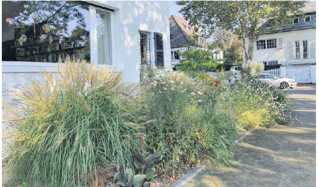
Lebendig gestaltete Vorgärten in einer Straße oder Siedlung sind wertvolle Beiträge zur Sicherung von Lebensräumen für Pflanzen, Insekten und Vögel und führen zu einer positiven Ausstrahlung.

Vorgärten spiegeln seit jeher den Zeitgeist wider. Früher dienten sie vor allem der Zierde und der Selbstdarstellung: Blumenbeete, Buchshecken und Rosenbögen prägten das Straßenbild und zeigten den Stil und auch den Stolz der Hausbesitzenden. Mit der zunehmenden Verdichtung in Städten, den immer kleiner werdenden Grundstücken und den wachsenden Anforderungen an moderne Gebäude wandelte sich jedoch das Bild des Vorgartens grundlegend. Die Fläche, die für eine klassische Gartengestaltung zur Verfügung steht, ist oftmals auf ein Minimum reduziert und muss - im Unterschied zu früheren Zeiten - viele Erwartungen erfüllen. Dort soll (möglichst verdeckt) Platz sein für die Mülltonnen, Fahrräder, immer öfter auch für Wärmepumpe und Wallbox, hinzu kommen Briefkasten, Beleuchtung, Zugang zum Haus... Dennoch bleibt der Wunsch nach einem einladenden, grünen Eindruck bestehen - auch auf wenigen Quadratmetern. Im Vergleich zu früheren Zeiten haben die Hausbesitzenden heute jedoch tendenziell weniger Gar-