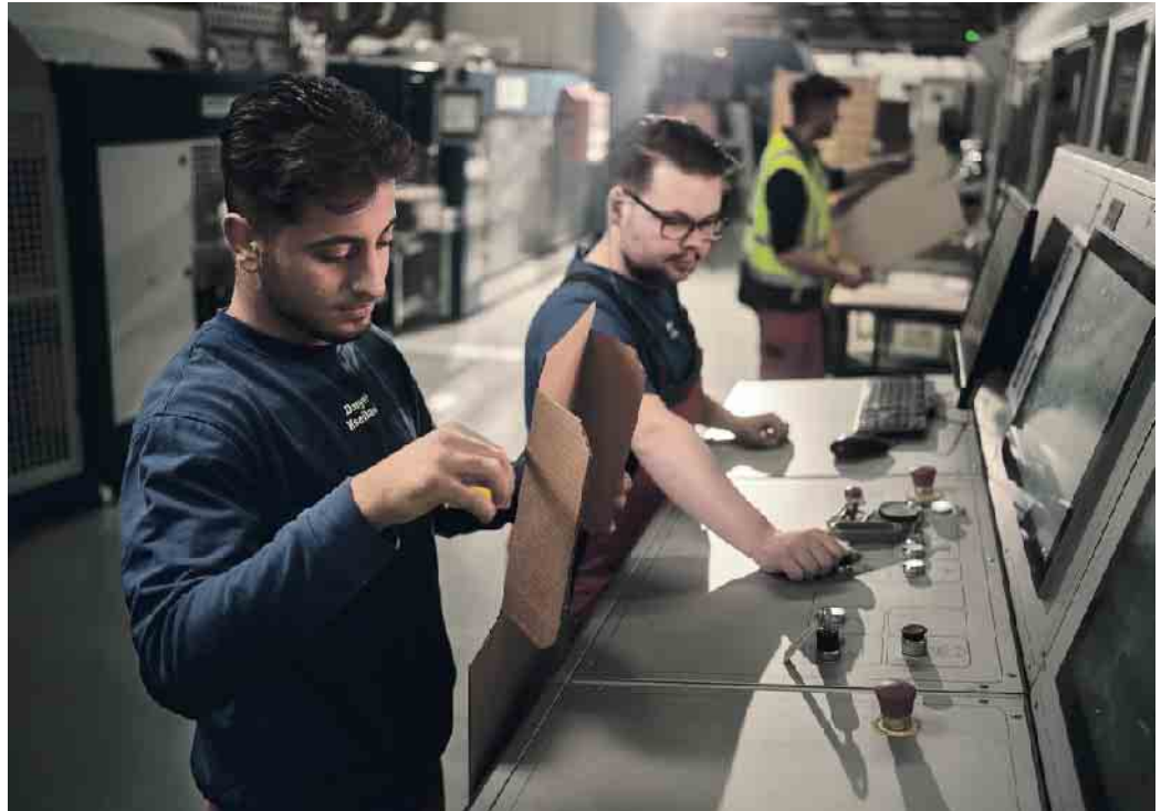
Packmitteltechnolog*innen produzieren innovative Verpackungslösungen.

Ob technisches Know-how, handwerkliches Geschick oder gestalterisches Denken - die Wellpappenindustrie bietet Ausbildungswege für verschiedene Talente und Vorlieben. Packmitteltechnolog*innen produzieren innovative Verpackungslösungen, Industriemechaniker*innen und Elektriker*innen sorgen für einen reibungslosen Betrieb der Maschinen und Industriekaufleute