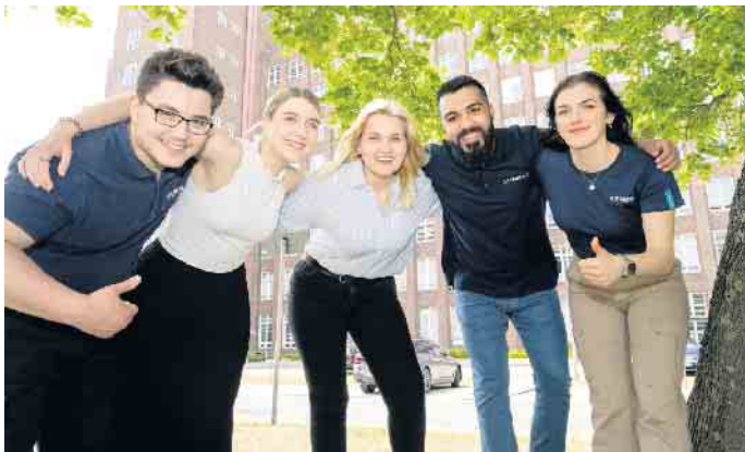
Junge Karrierestarter sollten ihr späteres Betätigungsfeld nach persönlichen Neigungen wählen.