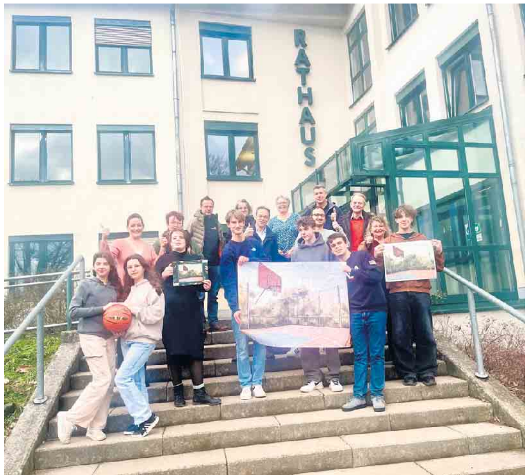
Foto mit Schüler*innen der Gesamtschule und Spender*innen: Gemeindesportbund, Kinderschutzbund, Schilling Group, Bedachungen Arnolds, TVN Baskets

Die Wunschbaum-Aktion ist eine seit 2014 gehegte Tradition in der Gemeindeverwaltung. 2023 erhielt sie erstmals ein neues Konzept, das zusammen mit dem Kinderschutzbund entwickelt wurde: Statt individueller Geschenke für benachteiligte Kinder und Jugendliche sollen mit dem PROJEKT-Wunschbaum nun Projekte und Ideen finanziell gefördert werden, von denen alle jungen Menschen im Stadtgebiet profitieren können. Um die Spendensumme und -bereitschaft visuell anzuzeigen, wird die Projektskizze - im letzten Jahr das Bild eines Basketballfelds - als Puzzle abgedruckt und Spenderinnen und Spender können durch ihren finanziellen Beitrag Puzzleteile spenden, die dann in der Summe das Projekt ergeben. Das erste geförderte Projekt ist nun dank der vielen Spenden zu einem vollständigen Puzzle zusammengesetzt worden und kann in die Umsetzung gehen: ein Basketballplatz auf dem Schulhofgelände der