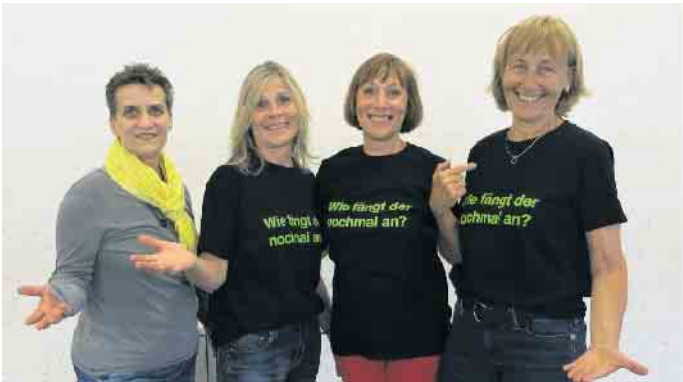
Eine oft gestellte Frage beim Linedance: Wie fängt der nochmal an...

22 Jahre TanzSportFreunde Seelscheid e. V. wollen wir zum Anlass nehmen, alle Tanzinteressierten zu einem Tag der offenen Tür einzuladen. Lernt uns und unsere Angebote kennen und vielleicht springt ja der Funke über und Ihr habt Lust, auch das Tanzbein zu schwingen. Mit Vorführungen und Workshops in den Sparten Linedance, Englische Tänze und Gesellschaftstanz ist für jeden etwas dabei. Egal ob allein oder als Paar, mit oder ohne Vorkenntnisse: Einfach mitmachen, ausprobieren und Spaß haben. Wann: 24. Februar von 14.30 bis 17.15 Uhr Wo: Aula der Grundschule Am Wenigerbach, Breite Str. 26, 53819 Seelscheid. Eine Anmeldung ist nicht erforderlich. Alle Infos unter „Aktuelles“: www.tanzsportfreunde-seelscheid.de Kontaktaufnahme per E-Mail: tanzsportfreunde-seelscheid@gmx.de Pressereferentin Andrea Krause