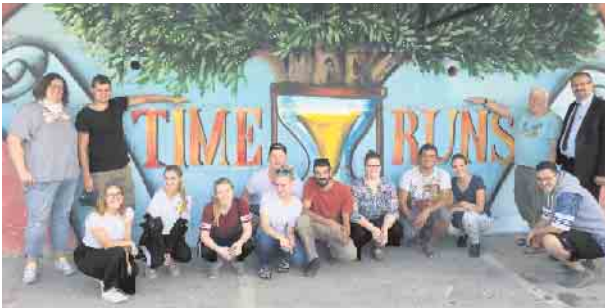
Kunstprojekt in Bethlehem

JugendInterKult e.V. bietet von Erasmus + besonders geförderten zweiseitigen Jugendaustausch (ca. 18-26 Jahre) in Israel-Palästina-Jordanien (30.9.–15.10., NRW-Oktoberferien) an mit tollem Programm und unschlagbarem Preis-Leistungs-Verhältnis. Bei Anmeldung bis 15.02. gibt es 160 € Frühbucherrabatt .