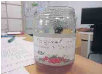
Ingwer und Kurkuma sind so gesund

Infos vom Familienzentrum St. Margareta, Neunkirchen-Seelscheid, Tel.: 02247-2313, E-Mail: kita-st-margareta@kath-nkse.de