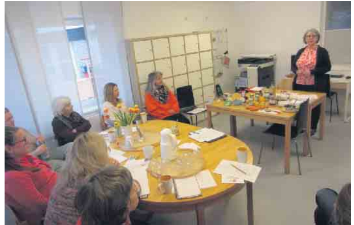
Vortrag über Heilmittel aus der Küche

Die Schöpfungsgeschichte ist das Thema an diesem Sonntag zu dem wieder alle Kinder im Alter von 0 bis 8 Jahre in Begleitung von