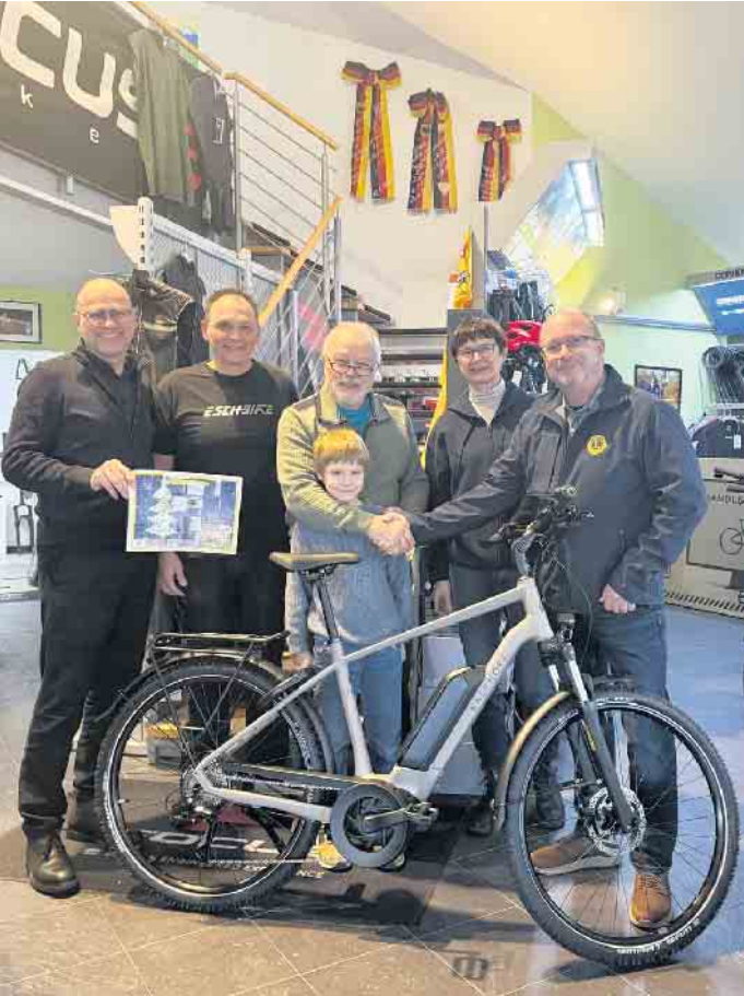
Ein glückliche Gewinner des E-Bikes

Lions Club übergab Hauptpreis des Adventskalenders im Wert von 3.000 Euro