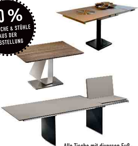
Alle Tische mit diversen Fuß- und Plattenvarianten erhältlich!

40 % AUF TISCHE & STÜHLE AUS DER AUSSTELLUNG