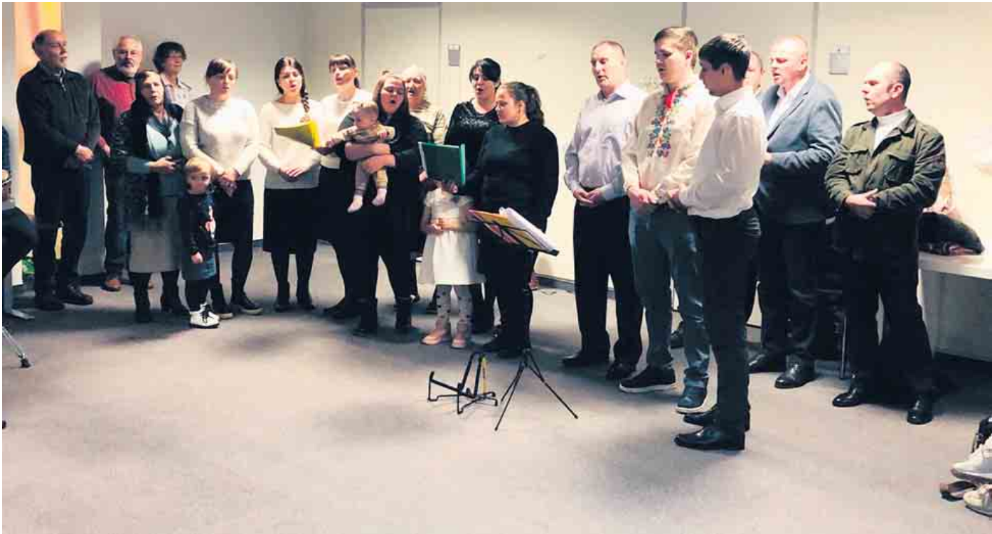
Weihnachtsfeier im Thurn-Gelände