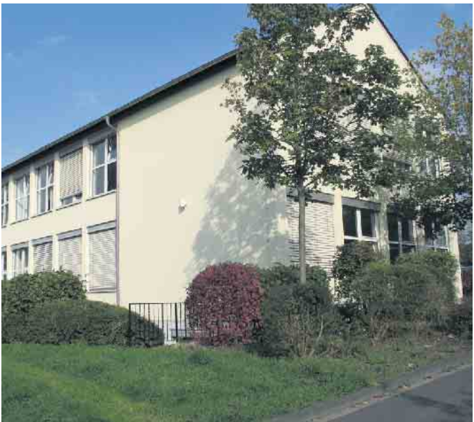
Schulgebäude in Neunkirchen