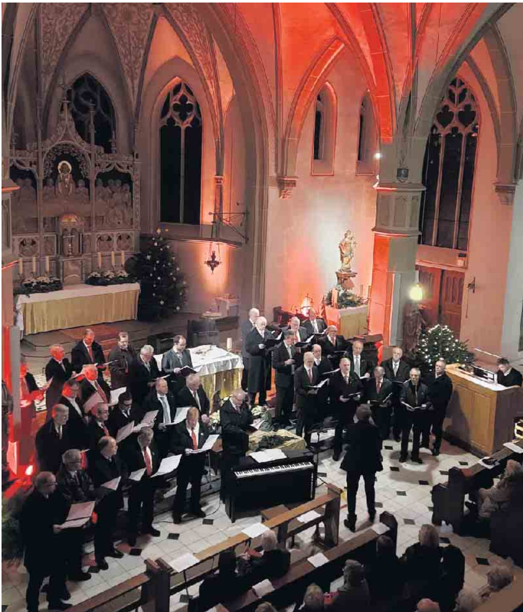
Dreikönigskonzert in St. Margareta

MGV Gemütlichkeit Söntgerath und Quartettverein Eischeid informieren