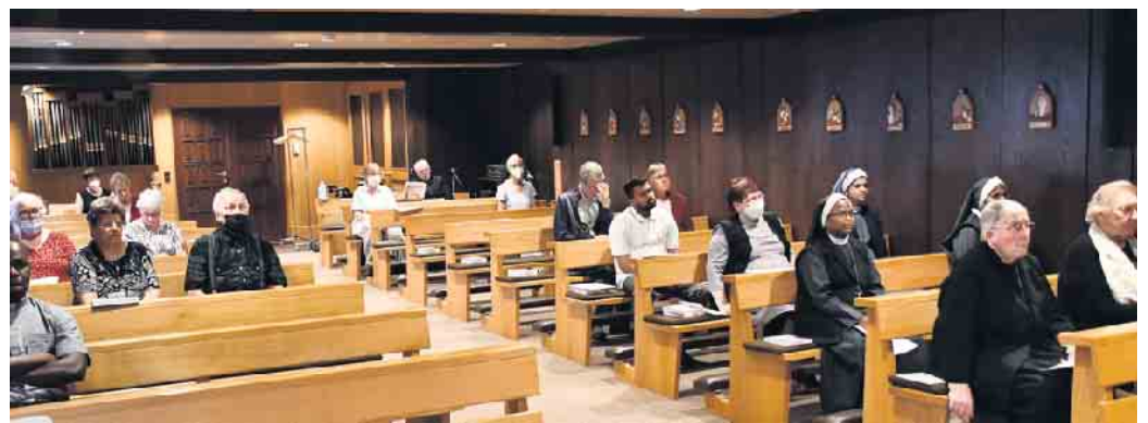
Zwei Dutzend Gläubige verfolgten den jüngsten Impulsabend bei der Communio in Christo in der Hauskapelle an der Bruchgasse.

Als schönes Bild echten Gottvertrauens und großer Lebenszuversicht nannte Ammann den Tod der leiblichen Schwester eines Mitbruders in den vergangenen Tagen. Sie sei so „unglaublich friedlich“ auf die andere Seite des Lebens gegliedert, dass ihr Bruder, Pater Ammanns priesterlicher Bruder, der Gemeinschaft in Mechernich versicherte: „Jetzt haben wir eine neue Fürsprecherin im Himmel.“