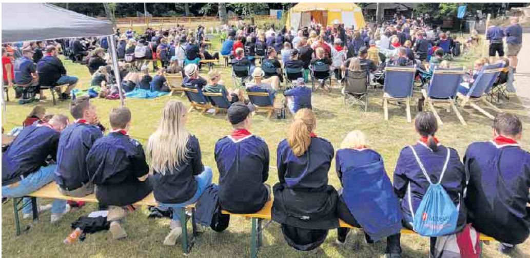
Mit einem Gottesdienst wurde das Bundesjugendlager der Malteser eröffnet. Insgesamt 500 Teilnehmerinnen und Teilnehmer bevölkerten die Wiesen rund um Burg Satzvey.

Die Kleidung der Malteser werde fair und nachhaltig produziert. Zudem seien viele Gruppen mit dem Zug angereist. Das rund 20-köpfige Küchenteam, das die rund 500 Teilnehmer von morgens um 6 bis abends um 22 Uhr versorge, kaufe die Produkte in der Region ein und versuche auf Verpackun-