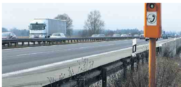
Alle zwei Kilometer steht eine Notrufsäule an der Autobahn. Ein Pfeil und eine Zahl auf den Leitpfosten geben Richtung und Abstand an.

dort die rettenden Engel bestellen. Obwohl die meisten Menschen in Notfällen zum Handy greifen, laufen diese schon mal Gefahr, dass ihnen der Saft ausgeht - natürlich genau dann, wenn das Auto den Geist aufgibt. Von Funklöchern ganz zu schweigen. Die Zahlen belegen durchaus den Sinn der Säulen: Jährlich werden über diesen Weg immerhin circa 46.000 Notrufe abgesetzt, im Schnitt alle elf Minuten einer. Wer spricht? Seit 1999 landen die Anrufe beim Notruf der Autoversicherer in Hamburg und werden an den zuständigen Notdienst weitergeleitet. Im Gegensatz zum Anruf per Handy braucht man sich dabei keine malerische Beschreibung des Standorts zu überlegen: Dieser wird nämlich direkt an die Notrufzentrale übermittelt. Generell gilt: Bei Notfällen Ruhe bewahren! Stellen Sie das Warndreieck auf und schalten Sie die Warnblinkanlage ein. Vergessen Sie nicht, die Warnweste anzuziehen! Warten Sie nach dem Absetzen des Notrufs hinter der Leitplanke auf Hilfe. (mid/ak)