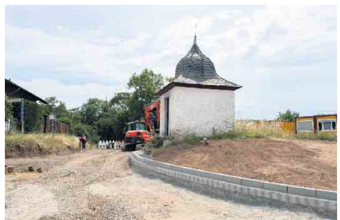
Das ist knapp, aber die 1668 zu Ehren des Heiligen Severinus erbaute denkmalgeschützte Kapelle kann an ihrem angestammten Platz stehen bleiben.