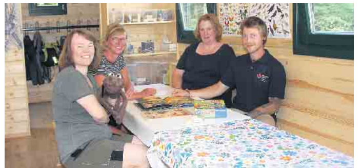
Jeden Tag möchte das Team mit den Kindern in den Wald gehen, aber im Aufenthaltsraum gibt es auch Bastelmaterial, Spiele und Bücher für die Förderung der Kinder.

einem zusätzlichen Bauwagen auch noch um eine weitere Gruppe ergänzt werden“, erzählt Blankenheims Bürgermeisterin. Aktuell ist der Waldkindergarten, der sich in Mülheim direkt am Waldrand hinter dem Sportplatz befindet, auf eine Gruppe mit 20 Kindern ausgelegt. Die sechs Plätze für Kinder unter drei Jahren sind schon belegt, für Kinder ab drei Jahren sind aktuell noch sieben