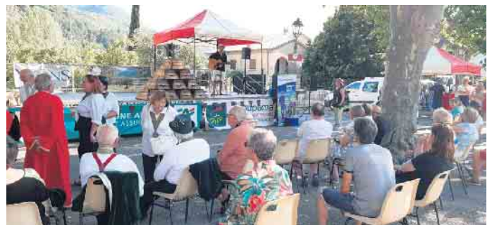
Die Franzosen, die trotz der Hitze über den Weinmarkt schlenderten, hielten inne und hatten Spaß an den Chansons des Eifeler Musikers.

Hochgürtel mit seiner Familie wohnt, reichlich Gelegenheit, sich im Swimmingpool von Hervé Gougouzian von den Strapazen zu erholen.