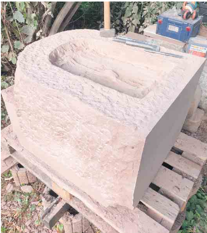
Die spätere Form ist bereits erkennbar, aber bis zur Fertigstellung des Schreins braucht es noch einige Hammerschläge von Steinmetz Martin Stoffels.