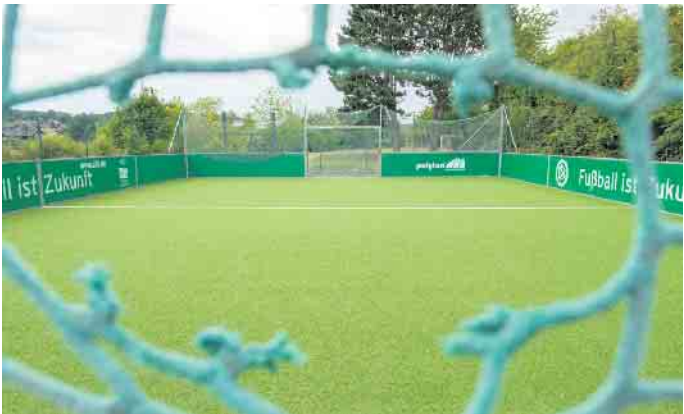
Ein neuer Kunstrasenbelag auf dem DFB-Kleinspielfeld lässt Kicker-Hezen höherschlagen. Neue Netze sind bestellt. Foto: Ronald Larmann/pp/Agentur ProfiPress

2,50 Meter breite Weg den Mitarbeitern des Bauhofs die Erreichbarkeit und damit die Pflege des Geländes und der Rasenflächen. Aschebahn ist Geschichte Wer die ebenfalls frisch sanierte Treppe Richtung Sportplatz hinuntergeht, sieht eine weitere Neuerung. Die Asche der 100-Meter-Laufbahn ist Geschichte. Auch sie wurde durch eine moderne Tartanbeschichtung ersetzt. „Die Bahn ist insgesamt 130 Meter lang“, erläutert Christof Marx: „100 Meter zum Laufen, zehn Meter Aufstellbereich am Anfang sowie 20 Meter Auslaufbereich.“ Jetzt hofft Marx darauf, dass mit der neuen Anlage pfleglich umgegangen wird, damit alle Nutzerinnen und Nutzer möglichst lange etwas von den tollen Sportbedingungen haben. pp/Agentur ProfiPress