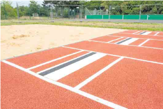
Balken optimal treffen und ab in die Grube: Beste Bedingungen gibt es nun auch für den Weitsprung.