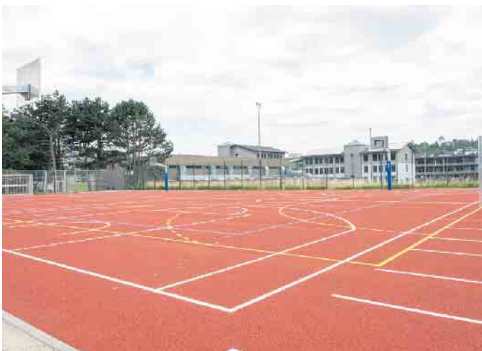
Weiß, Gelb, Blau - verschiedene Markierungen für verschiedene Sportarten. Das Multifunktionsspielfeld am Schulzentrum Mechernich erstrahlt in neuem Glanz.

Zum Schulstart erstrahlt Sportanlage am Mechernicher Schulzentrum in neuem Glanz - Modernes Multifunktionsspielfeld, neuer Kunstrasen und Tartanbahn für 100-Meter-Läufe dank Bundes- und Landesförderung