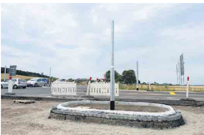
Mehr Sicherheit und ein besserer Verkehrsfluss - das sind die Gründe für den Bau einer Ampelanlage am Abzweig nach Eicks. Die Masten für die Installation stehen bereits.