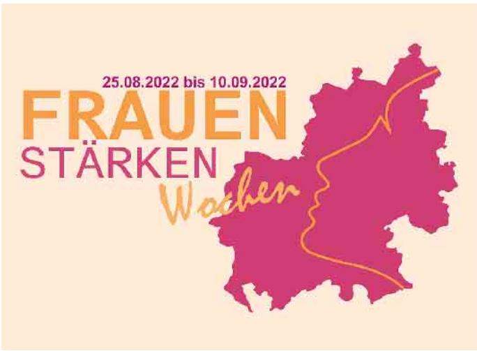
Mit diesem Poster werben die Macherinnen und Macher der Frauen-Stärken Wochen für die Veranstaltungen, die vom 25. August bis zum 10. September stattfinden.

Zum Auftakt wird Nicole Staudinger am Freitag, 25. August, um 19 Uhr im Stadttheater Euskirchen aus ihrem Bestseller „die Schlagfertigkeitsqueen“ lesen. „Staudinger zeigt, wie frau nie mehr sprachlos ist und bietet einen Leitfaden für ein starkes weibliches Selbstbewusstsein“, kündigen die Macherinnen der Frauen-Stärken-