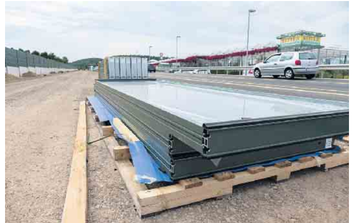
Bei den hohen Schallschutzwänden, werden oben Glaselemente eingesetzt. Das lässt das Bauwerk optisch kleiner erscheinen. Foto: Ronald Larmann/pp/Agentur ProfiPress

Fundament auf Stein gebaut worden. Das hat ein einfaches Versetzen unmöglich gemacht“, sagt Andreas Groß. Daher werden die künftigen Nutzer der vierspurigen Trasse nach der Fertigstellung zahlreiche Neuerungen wahrnehmen, aber eines bleibt gleich: St. Severinus steht auch nach 334 Jahren noch an derselben Stelle. pp/Agentur ProfiPress