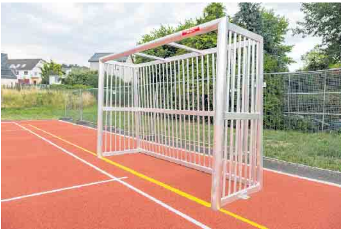
Massive Bauweise: Hier zappelt der Ball nicht im Netz, sondern in soliden Stahlstreben.