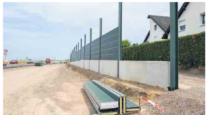
Weniger Lärm für die Anwohner soll mit der Schallschutzwand erreicht werden. Für eine bessere Optik soll sie an der Rückseite noch bepflanzt werden.