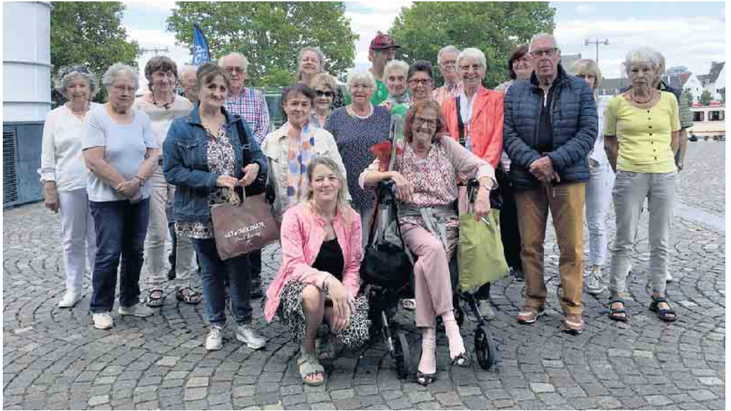
Auf geht's nach Maastricht: Die Teilnehmerinnen und Teilnehmer erwartete dort ein Mittagessen, eine Schiffstour und ein geführter Stadtpaziergang.

Dorthin waren 30 Kinder und 18 Erwachsene aufgebrochen, um einen Tag mit wilden Tieren, Pommes Frites und ganz viel guter Laune zu genießen - auch wenn das Wetter etwas durchwachsen war. Interessante Stadtpaziergänge Freundlicher war Petrus den 32 Senioren und zwei Betreuerinnen gesonnen, die einen Tag nach dem Zoo-Ausflug in Richtung