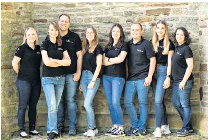
Die Sacro-Pop-Band „Spirit“ gastiert während ihrer Eifel-Tournee am Samstag, 13. August, um 18 Uhr auf der Burg Reifferscheid.