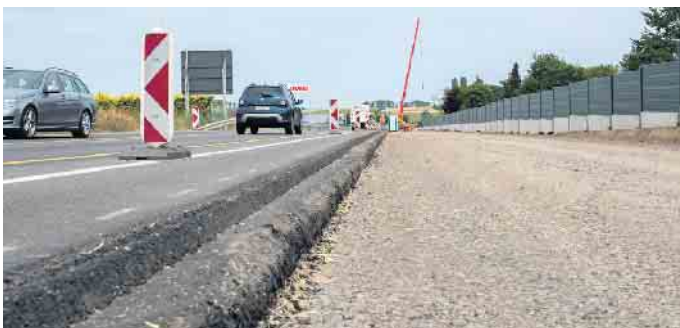
Wenn die Lärmschutzwand steht, ist als nächstes die Fahrbahn an der Reihe. Für die Asphaltarbeiten wird es eine viertägige Vollsperrung der K 20 geben.