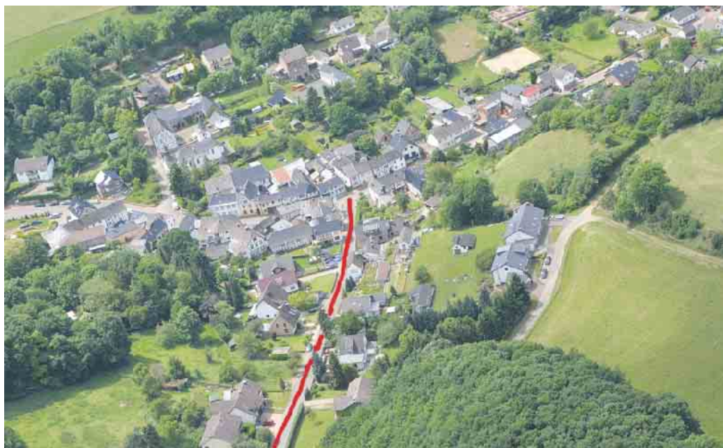
Die Straße „Am Weinberg“ (hier rot markiert) in Mechernich-Eiserfey wird von Montag, 8. August, bis Freitag, 12. August, voll gesperrt werden. Grund sind Hausanschlussarbeiten.