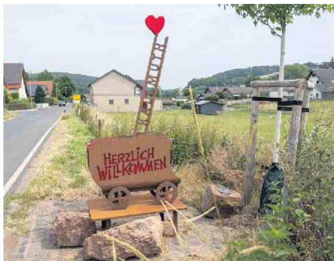
Eine Lore als rostende Erinnerung an die Bergbauergangenheit am Bleiberg. Das Kunstwerk von Franz Kruse steht am Schevener Weg.