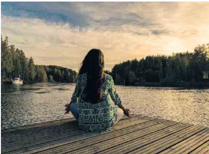
Workshops zu Achtsamkeit und Stressbewältigung gehören auch zum Programm der ersten Frauen-Stärken-Wochen im Kreis Euskirchen. Insgesamt können Frauen, Mädchen und Interessierte aus rund 50 Angeboten wählen.