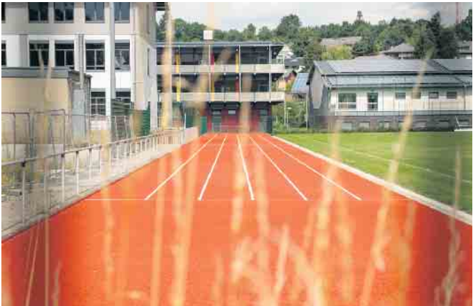
Blick durch die Vegetation und den Zaun auf die neue Tartanbahn für 100-Meter-Läufer.