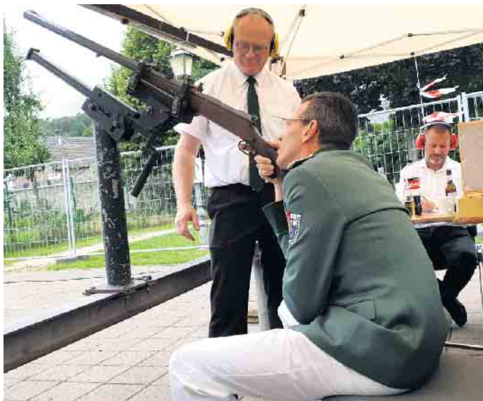
Immer ein Treffer: Die „St. Severinus“-Schützenbruderschaft kann vom 19. bis 21. August endlich wieder das Kommerner Schützenfest veranstalten.