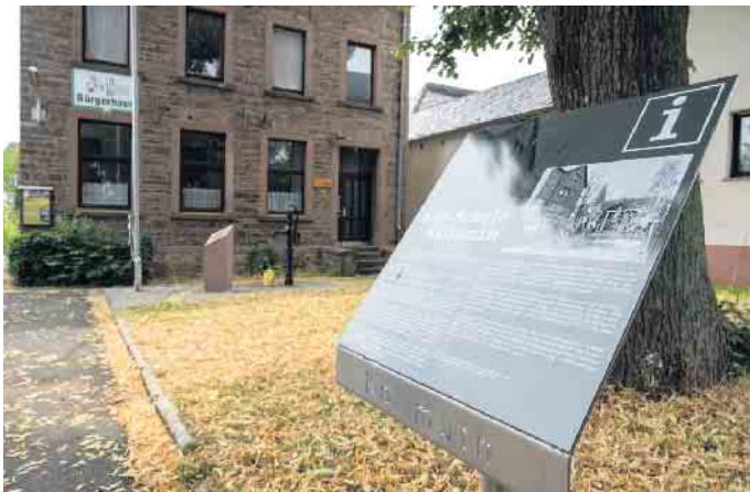
Attraktive Infotafeln sind überall im Dorf zu finden. Dieses Exemplar informiert über die Schulgeschichte des Ortes.