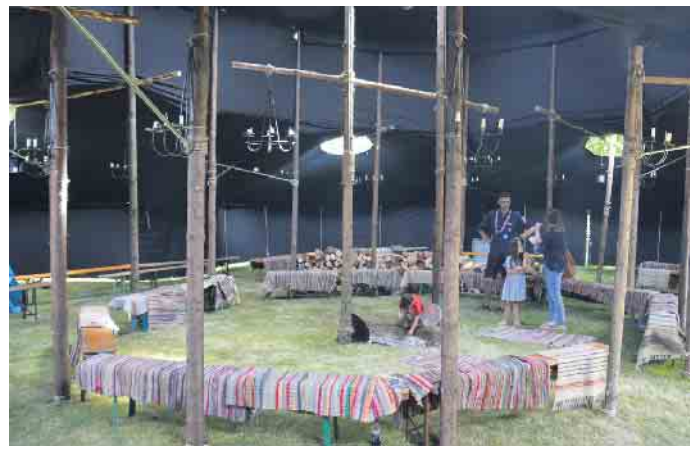
Sport, Stockbrot backen und basteln: In der geräumigen Jurtenburg wurde den Teilnehmern ein abwechslungsreiches Programm geboten.

gen zu verzichten. Verpackungsmüll werde dadurch reduziert, dass jeder Teilnehmer seine eigene Trinkflasche und eine Brotdose mitbringe.