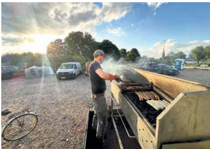
Wer arbeitet, benötigt Energie: Zünftige Verpflegung für die fleißigen Helfer kam vom Grill.