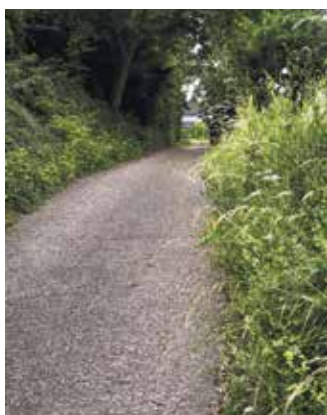
Spaziergänger nutzen ihn, Kinder und Familien sind dort unterwegs, auch Anliegerinnen und Anlieger schätzen die Wegeverbindungen abseits der Straßen.

Mechernich-Kommern - Der Grünzug „Fahnendriesch“ in Kommern zwischen Gielsgasse und Schützenweg: Spaziergänger nutzen ihn für den kurzen Weg durchs Grüne, Kinder und Familien sind dort unterwegs, auch Anliegerinnen und Anlieger schätzen die Wegeverbindungen abseits der Straßen. Hier möchte die Stadt Mechernich nun die Verkehrssicherheit verbessern. Konkret betroffen ist „die Wegeverbindung zwischen dem Schlegelweg und der Gielsgasse sowie angrenzende Teilabschnitte“. Dort wird die bestehende Beschilderung durch das Schild „Verbot für Fahrzeuge aller Art“ (Verkehrszeichen 250) ergänzt. Zusätzlich sollen an ausgewählten Stellen umlegbare Poller installiert werden.