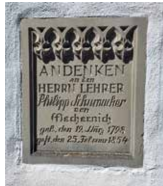
Die Gedenktafel an der Alten Kirche erinnert an den wegen seines sozialen Engagements bedeutenden Lehrer.

Nicht nur der weibliche Teil der Schülerschaft, auch die Jungen mussten