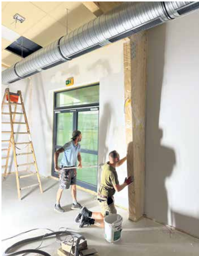
Nicht von der Rolle, sondern konzentriert bei der Arbeit: Helfer aus Firmenich-Obergartzem beim Streichen des DODO-Treffs.

Der Ursprung dieser Entwicklung liegt erst wenige Jahre zurück. Im August 2020 gründete sich der Verein aus der Mitte des Dorfes heraus. Hintergrund war eine spürbare Lücke im gesellschaftlichen Leben. Die letzte Gaststätte hatte geschlossen, Treffpunkte waren kaum noch vor-