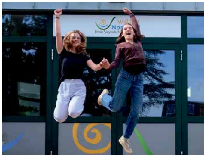
Die Freie Veytalschule lädt am Samstag, 27. Juni zum öffentlichen Johannifest mit Verlosung ein. Besonders willkommen sind als Ritter, Burgfräulein, Gaukler, Magd oder Knappe verkleidete Gäste.