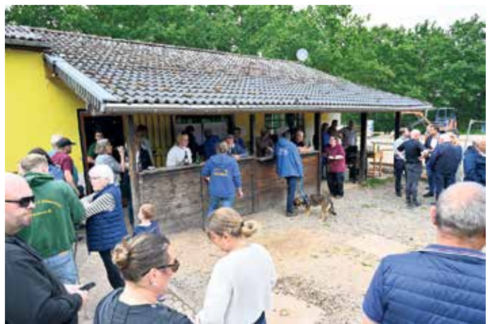
Im Anschluss an den offiziellen Teil gab's kühle Getränke und heißes Grillgut.