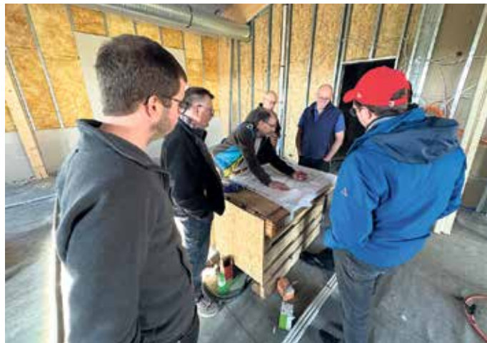
Koordination ist alles: Hier besprechen einige Freiwillige die anstehende Aufgabenverteilung am Bau.