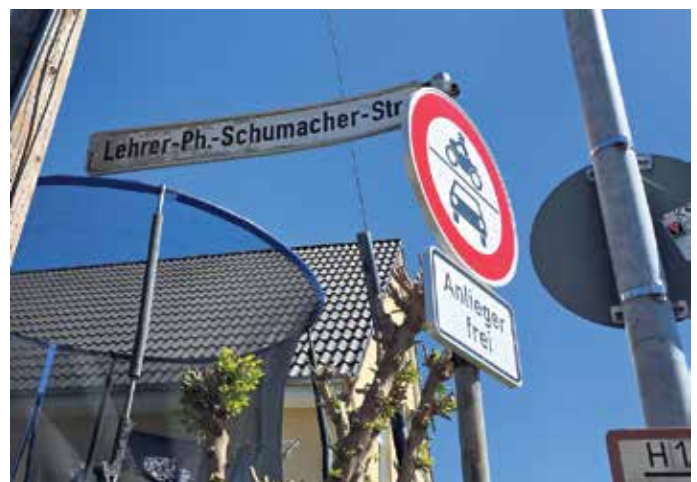
Die Straße zwischen Kier und Alter Kirche wurde nach ihm benannt.