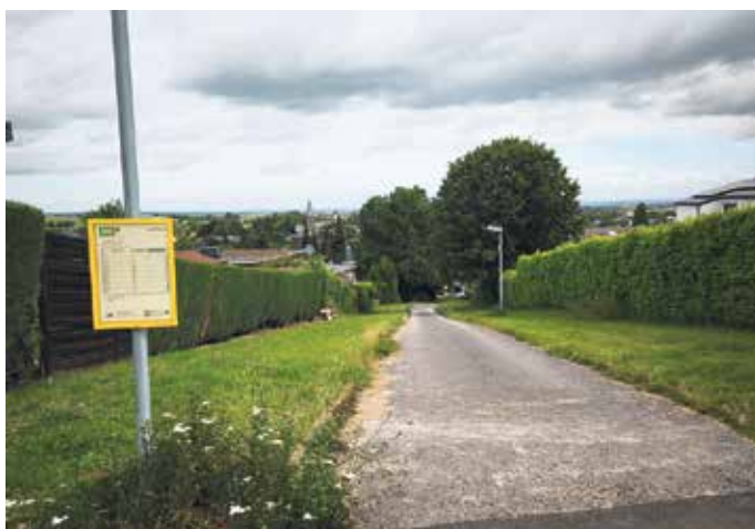
Die Stadt Mechernich verbessert die Verkehrssicherheit im Kommerner Grünzug „Fahnendriesch“ mit einer neuen Beschilderung und umlegbaren Pollern zwischen Schlegelweg und Gielsgasse.

Stadt Mechernich verbessert Verkehrssicherheit in Kommern - Neue Beschilderung und umlegbare Poller zwischen Schlegelweg und Gielsgasse