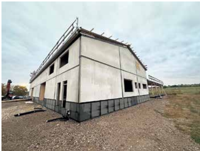
Der Rohbau steht und lässt die künftige Dimension des DODO-Treffs.

an den Tischen kleine Blumen, alles wirkt einladend und gleichzeitig ganz selbstverständlich.