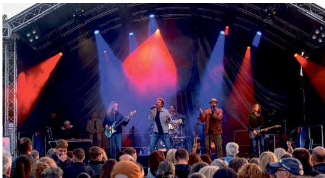
Ein Abend in Rot und Blau: Die Bläck Fööss sorgten mit ihrer Musik beim Jubiläumsfest des SV Concordia Weyer für kölsche Gänsehaut mitten in der Eifel.

Für den passenden Rahmen auf dem Platz sorgte Schiedsrichter Thomas