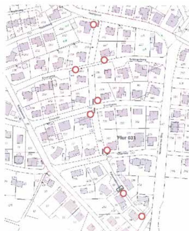
Diesen Plan hat die Stadtverwaltung dazu veröffentlicht.

Mechernich-Kommern - Der Grünzug „Fahnendriesch“ in Kommern zwischen Gielsgasse und Schützenweg: Spaziergänger nutzen ihn für den kurzen Weg durchs Grüne, Kinder und Familien sind dort unterwegs, auch Anliegerinnen und Anlieger schätzen die Wegeverbindungen abseits der Straßen. Hier möchte die Stadt Mechernich nun die Verkehrssicherheit verbessern. Konkret betroffen ist „die Wegeverbindung zwischen dem Schlegelweg und der Gielsgasse sowie angrenzende Teilabschnitte“. Dort wird die bestehende Beschilderung durch das Schild „Verbot für Fahrzeuge aller Art“ (Verkehrszeichen 250) ergänzt. Zusätzlich sollen an ausgewählten Stellen umlegbare Poller installiert werden.