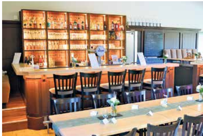
Fertig: Die Theke ist ein echter Hingucker und gemüthlicher Treffpunkt. Auf der Zapfanlage darf auch das DODO-Treff-Logo nicht fehlen.