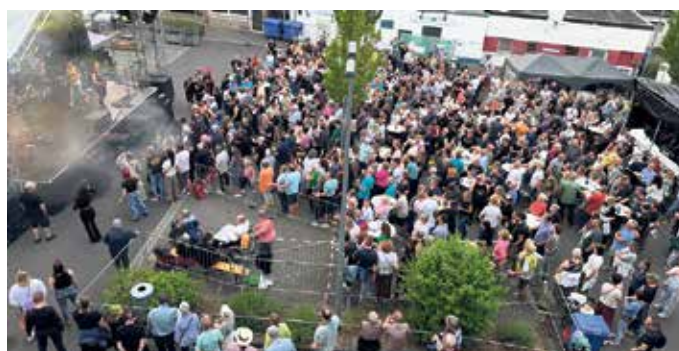
Ein Blick von oben auf die Menge.

Eventmanagement“ sowie den Anwohnerinnen und Anwohnern, die den rockigen Abend bis Mitternacht mittrugen.