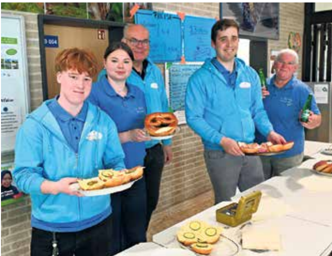
Die Weltjugendtagsgruppe des Pastoralen Raums Mechernich übernahm das Catering. Der Erlös kommt den Jugendlichen zugute, die sich auf den Weg zum Weltjugendtag nach Südkorea machen wollen.

Jugendlichen zugute, die sich auf den Weg zum Weltjugendtag nach Südkorea machen wollen.