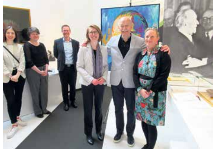
Bei der feierlichen Übergabe des Gemäldes „Konrad Adenauer - Europa muss geschaffen werden!“

So endete der Besuch in Rhöndorf nicht nur mit einem neuen Kunstwerk für die Sammlung der Stiftung,