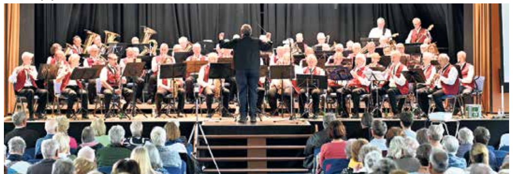
Das Ü50-Blasorchester der Eifel begeisterte beim Frühlingskonzert in der Aula des Mechernicher Gymnasiums Am Turmhof.

So traf der „River-Kwai-Marsch“ auf ein Medley der Hits von James Last, „Böhmische Souvenirs“ auf „Ramona“ und der 90er-Jahre-Partyhit „Mambo No. 5“ auf klassische Blasmusiktradition. Peter Züll hatte die Stücke wie gewohnt für die Besetzung des Orchesters angepasst - so klangen sie frisch arrangiert,