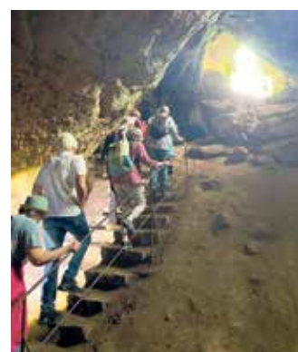
Auf die Spur von Kakus dem Riesen begab man sich in der namensgebenden Höhle.