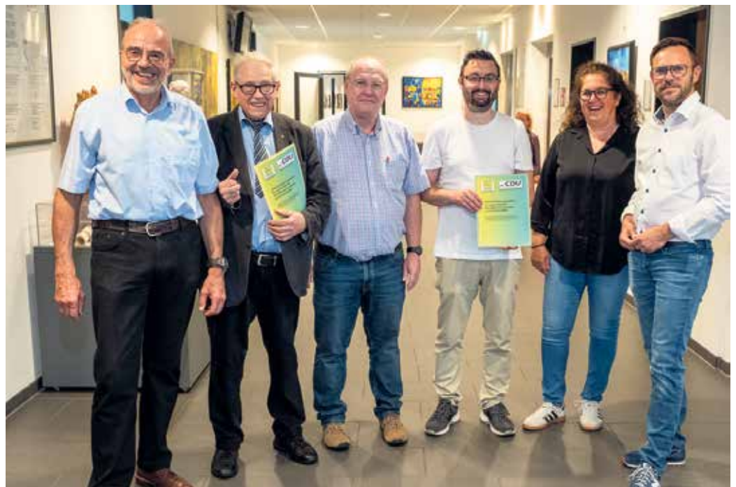
Kooperations-Team nach der Unterzeichnung.

Auch die Zusage des Bundes zur Realisierung des vierten Autobahnanschlusses in Satzvey sowie die damit verbundene Verbesserung der Verkehrsführung im Ort sind ein Ergebnis unserer Arbeit, die wir mit Nachdruck weiter voranbringen.