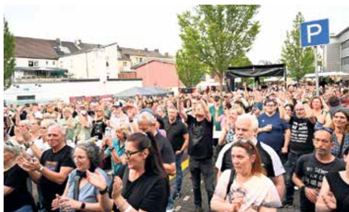
Zugabe! Das Publikum war Feuer und Flamme.