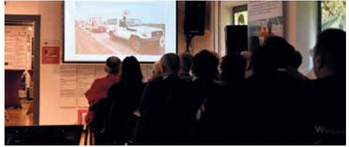
Anhand eines Rotkreuz-Konvois machte Sieland das Neutralitätsgebot deutlich.

Sieland plädierte dafür, Resilienz auf kommunaler Ebene zu stärken. Selbsthilfefähigkeit sei kein Panikthema, sondern das Gegenteil: Wer weiß, was er tun kann, bleibt handlungsfähig. Erste-Hilfe-Kurse mit Selbsthilfeanteil, Pflegeunterstützungsstrukturen und klare lokale Strukturen wurden als wichtige Bausteine genannt. Henes brachte es am Ende pragmatisch auf den Punkt: Angesichts des großen Bedarfs sei es letztlich zweitrangig, ob sich Menschen bei Feuerwehr, THW, Rotem Kreuz, Maltesern, Johannitern