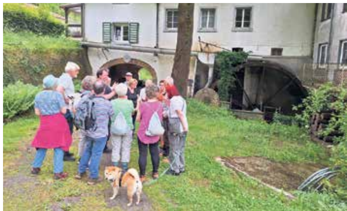
Eine Station der beliebten Erlebnis-Wanderung „Rund um die Kakushöhle“ Ende Mai war die historische Hauserbachmühle.

Erlebniswanderung „Rund um die Kakushöhle“ begeisterte Wanderfreundinnen und -freunde bei bestem Wetter