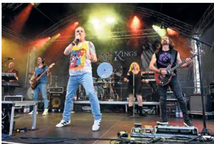
„The Queen Kings“ lieferten bei Rock am Rathaus in Mechnich große Gesten, starke Stimmen und jede Menge Gänsehaut.

So viele Besucherinnen und Besucher wie nie zuvor bei „Rock am Rathaus“: „TresHombres“, „The Queen Kings“ und „Rockwood“ lieferten Gänsehaut und große Klassiker - Spende an Mechnich-Stiftung