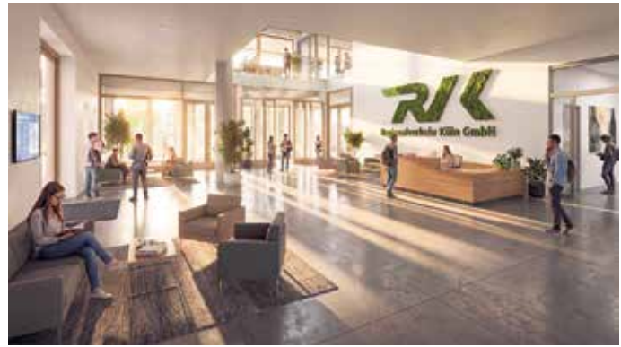
Nur eine Idee: Mithilfe von KI haben die Architekten und Planer eine mögliche Ausgestaltung des Akademie-Foyers erstellt. Bild: agn Architekten/pp/Agentur ProfiPress

Ebenfalls öffentlich nutzbar - nach vorheriger Anmeldung - soll die Fahrsicherheitsanlage sein. Dort sollen Fahrerinnen und Fahrer den Umgang mit modernen Fahrzeugen