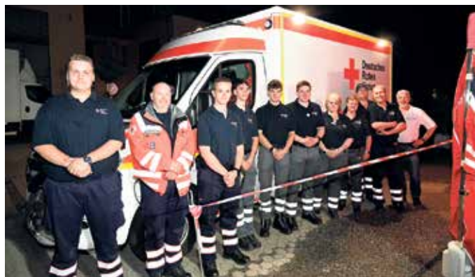
Bis tief in die Nacht hielten die Rotkreuzler die Stellung.