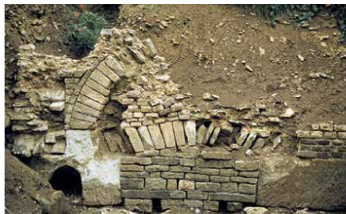
Die römische Brunnenstube Klausbrunnen in Mechernich-Kallmuth während der Ausgrabung 1953.