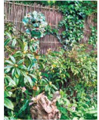
Überall gibt es etwas zu entdecken, wie diesen frechen „Green Man“ vor Azaleen, Efeu und Rhododendren.