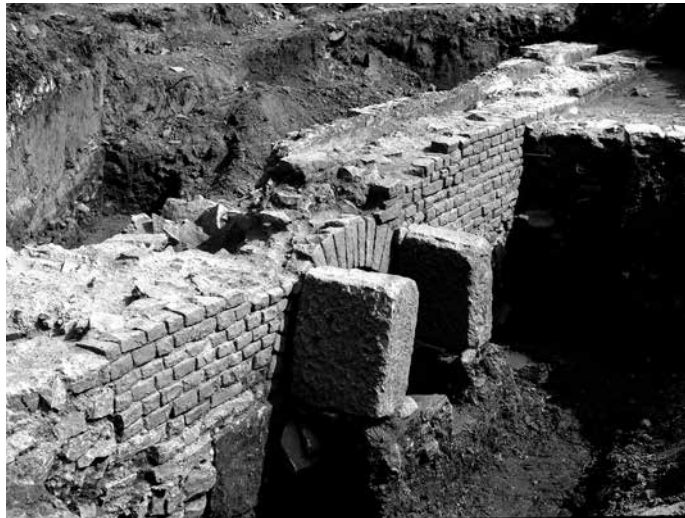
Die römische Aquäduktbrücke in Mechernich-Vollem/Urfey ist eine der Stationen der geführten Wanderung.