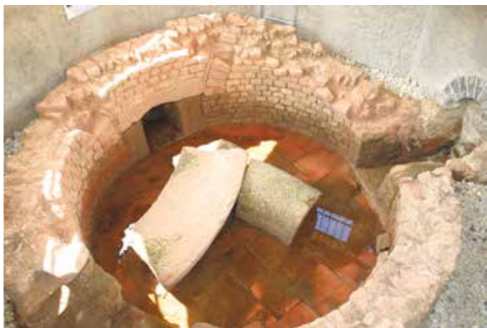
Der Klausbrunnen war bei einem Wasserereignis im Februar 2020 noch einmal „in Betrieb“.

Vortrag über „Techniken der Wassergewinnung in römischer Zeit“. Einen Fokus legt er dabei auf den Klausbrunnen in Kallmuth als „ergiebige Brunnenstube zur Versorgung der „Colonia Claudia Ara Agrippinensium““, denn diese ist ein besonders schön rekonstruiertes Beispiel für eine römische Quellfassung.