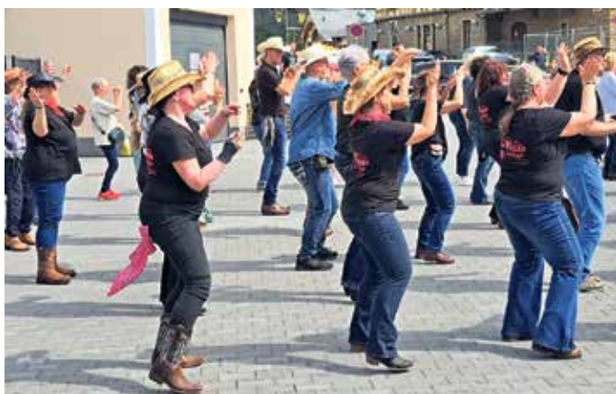
Synchron, schwungvoll und mit sichtbarer Freude: Mehr als 140 Teilnehmer tanzten beim Flashmob gemeinsam zu Country- und Popmusik.