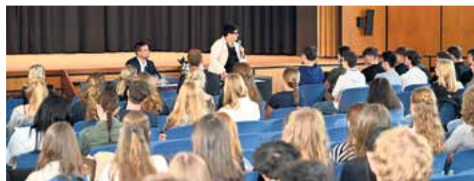
Die Aula war gefüllt mit vielen neugierigen Jugendlichen.

Am Ende wurde aus der geplanten Veranstaltung fast ein längerer Europaworkshop. Einige Schülerinnen