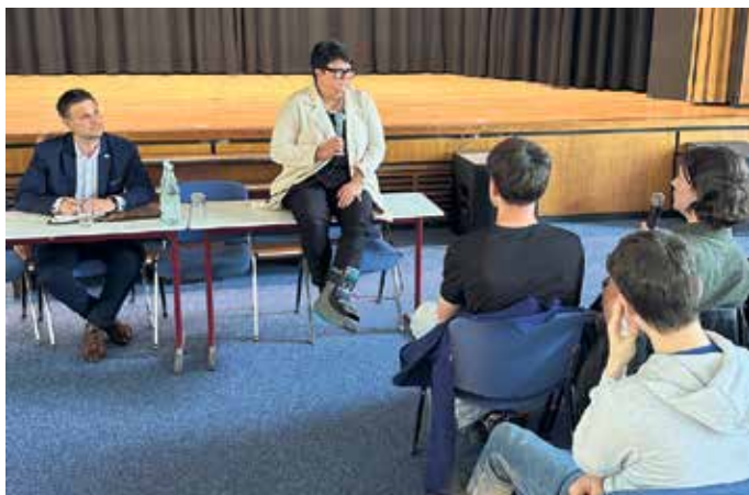
Verheyen nahm sich Zeit für jede Frage.

mit Stadtentwicklung und Bildung. Im Europäischen Parlament arbeitete sie lange im Kultur- und Bildungsausschuss. Heute gehört sie als erste Vizepräsidentin dem Präsidium des Parlaments an und ist unter anderem mit Fragen des Parlamentshaushalts, der Kommunikation, des Standortes Luxemburg und dem Einsatz künstlicher Intelligenz in der Parlamentsverwaltung befasst.