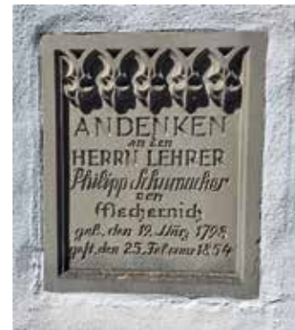
Die Gedenktafel an der Alten Kirche erinnert an den wegen seines sozialen Engagements bedeutenden Lehrer.