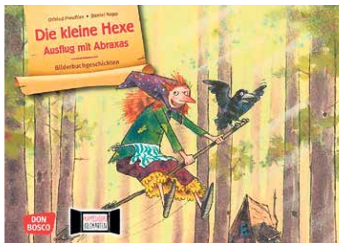
Am 2. Juni wird in der Stadtbücherei Mechernich aus „Die kleine Hexe - Ausflug mit Abraxas“ von Otfried Preußler vorgelesen.