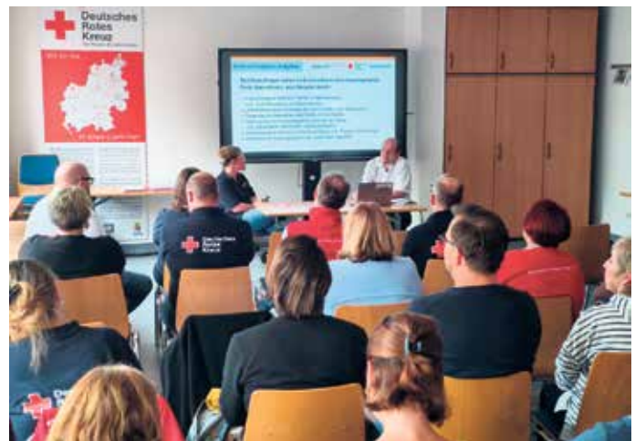
Beim Review zum Ende des zweiten Projektzyklus von #Zukunft machen stellten alle vier Teams (hier das Team „Führungs- und Konfliktkultur“) nacheinander die Zwischenergebnisse vor.

Euskirchen - Im Rotkreuz-Zentrum Euskirchen fand kürzlich das Endreview zum zweiten Projektzyklus von #ZukunftMachen beim DRK-Kreisverband Euskirchen statt. Mitarbeitende aus den vier Innovationsteams präsentierten die Fortschritte und Ergebnisse ihrer aktuellen Projekte und stellten der Steuerungsgruppe die nächsten Schritte auf dem Weg zu einer zukunftsfähigen Organisationsentwicklung vor.