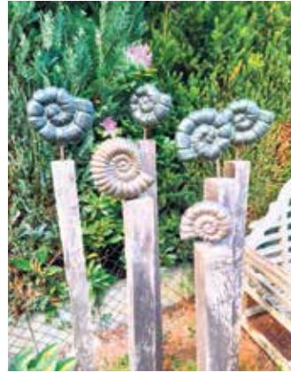
Im Metall-Look: Schneckenhäuser aus Ton, glasiert mit metallisch schimmernder Farbe neben einer hölzernen Ruhebänk.