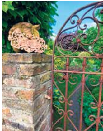
Rostiges Schmiedeeisen trifft altes Mauerwerk. Durch das schnörkelige Gartentörchen fällt der Blick auf einen sanft geschwungenen Pfad.