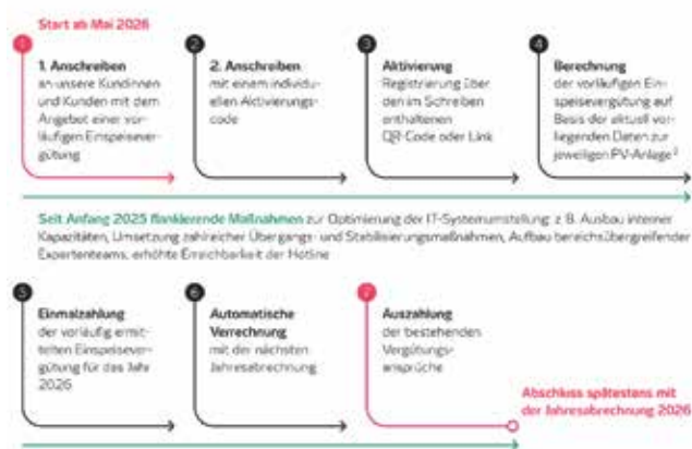
Vorläufige Einspeisevergütung für die Mechernicher Kundinnen und Kunden der Westnetz – Einmalzahlung als Übergangslösung ohne finanziellen Nachteil

Westnetz verantwortet in der gesamten Region Westliches Rheinland nach Angaben von Westenergie Planung, Bau, Instandhaltung und Betrieb von 14.200 Kilometern Strom-, 3.600 Kilometern Gas- und 1.475 Kilometern Wassernetz. Insgesamt 465 Mitarbeitende sorgten in der Region an 365 Tagen im Jahr für eine zuverlässige Energieversorgung. Bei Fragen zu Netzanschlüssen ist