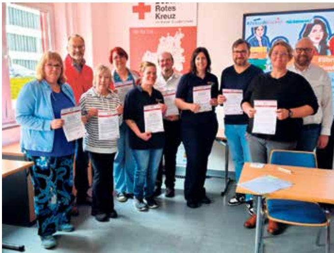
Die Mitglieder im Team „Gute Arbeitsbedingungen“ widmeten sich der Überarbeitung und Neugestaltung der Corporate Benefits.

Projekt #ZukunftMachen beim DRK Euskirchen: - Teams gaben zum zweiten Mal Einblick in den Zwischenstand: - Von Corporate Benefits über Wissensdatenbank bis Nachhaltigkeitskonzept und Rotkreuz-Spirit - Abschluss für Ende Juni 2027 geplant