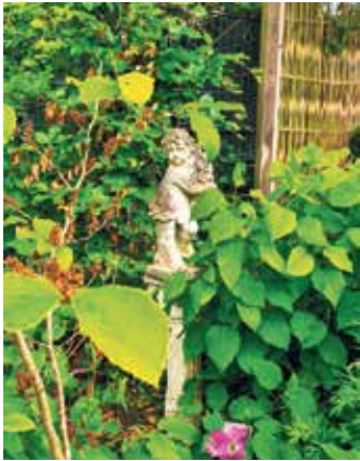
Noch blühen sie nicht: Bald werden herrliche Hortensien diesen Engel in seinem verwunschenen Eckchen flankieren.