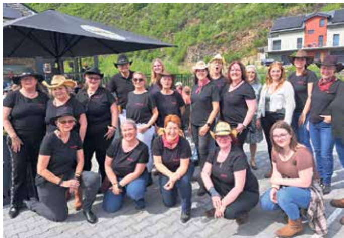
Die „VeyValley Linebraker“ der BSG Mechernich 1966 nahmen mit zahlreichen weiteren Tänzern am internationalen „Linedance-Flashmob“ in Altenahr teil.