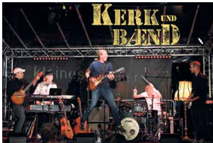
„Kerk und Baend“ spielt am 27. Juni „bei Stein’s“ in Voißel rockige Titel und berührende Balladen in der geliebten „kölschen Sproch“.