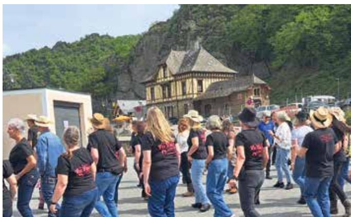
Vor der beeindruckenden Kulisse des Altenahrer Bahnhofs wurde der Parkplatz am „Saloon“ kurzerhand zur Tanzfläche.

Haben Sie Fragen zur Verteilung dieser Zeitung?