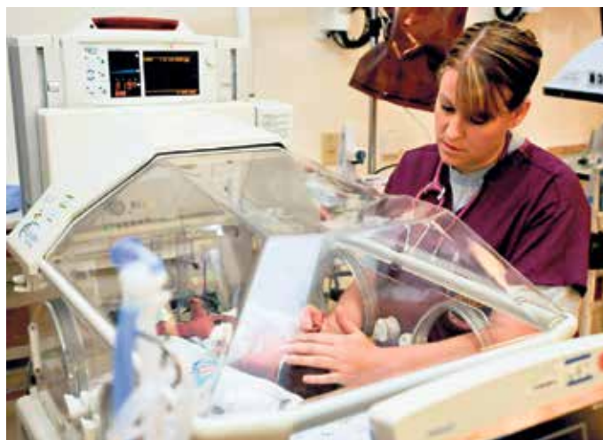
Über Berufe im Gesundheitssektor können sich Interessierte am Donnerstag, 18. Juni in der Alten Tuchfabrik informieren. Bewerbungsunterlagen werden auf Wunsch von Profis abgecheckt.

Die Gesundheitsbranche bietet verlässliche Perspektiven, heißt es in der Ankündigung: Neben fachlicher Qualifikation sind auch Lebenserfahrung und soziale Kompetenzen gefragt. - Beste Voraussetzungen also für einen Neu- oder Wiedereinstieg. Für Schülerinnen und Schüler bietet die Veranstaltung zusätzlichen Mehrwert: Die Teilnahme am Praxisparcours kann für den Jahrgang acht als Berufsfelderkundung im Rahmen von „Kein Abschluss ohne Anschluss“ anerkannt werden, ab Jahrgang neun als eintägiges Schnupperpraktikum. Zudem bietet die Agentur für Arbeit vor Ort einen „Bewerbungsmappen-Check“ an. Organisiert wird die Messe gemeinsam von der Struktur- und Wirtschaftsförderung des Kreises Euskirchen, der Kommunalen Koor-