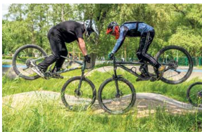
Am 4. Juli dreht sich im Kommerner Mühlenpark alles um den „Aktionstag rund um den Pumptrack Mechernich“. Mit im Boot sind die „Mud Monkeys“ aus Wachendorf, das Rote Kreuz und die Stadt Mechernich.

Ab 12 Uhr übernimmt dann der „Mud Monkeys Wachendorf e.V.“