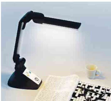
Mit einer flexibel einstellbaren Leuchte lässt sich das gewünschte Objekt besser in den Fokus nehmen.

führen, dass sich der Lichtbedarf für eine bestimmte Sehaufgabe um ein Vielfaches erhöht. Mit einer speziellen LowVision-Leuchte lässt sich dann für Betroffene oft viel verbessern - zum Beispiel mit der LED-Tischleuchte aus der Serie Multilight Pro von Schweizer Optik. Sie liefert blendfrei-