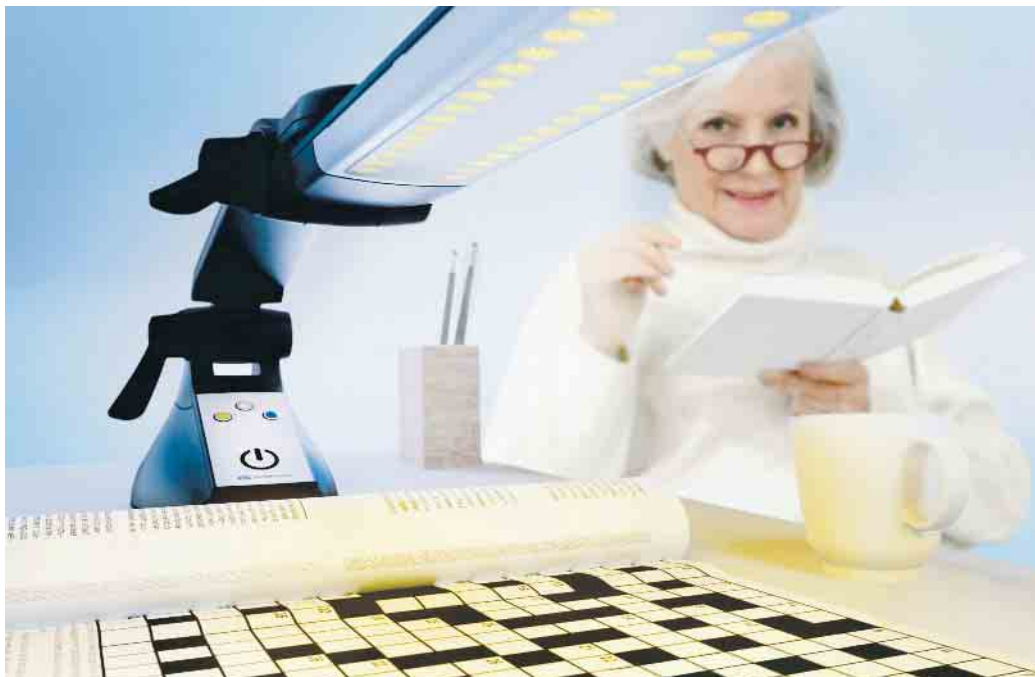
Stadt in Sachsen mit fünf Buchstaben? Um Kreuzworträtsel zu lösen, benötigen Menschen mit Sehbehinderung eine gute Beleuchtung.

Gerade Menschen, die unter einer Sehbehinderung leiden, sind auf helles, blendfreies Licht angewiesen. Denn Alterungsprozesse sowie Trübungen und Einschränkungen aufgrund von Augenerkrankungen wie Grauer Star oder Makuladegeneration können dazu