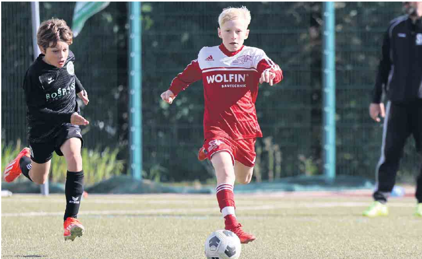
Jano Schwendich Bericht auf Seite 6