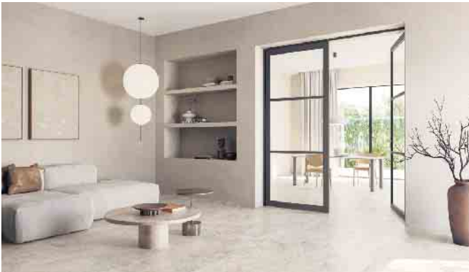
Grenzenlos wohnen: Mit keramischen Fliesen lassen sich verschiedene Lebensbereiche schwellenlos und optisch aus einem Guss verbinden.