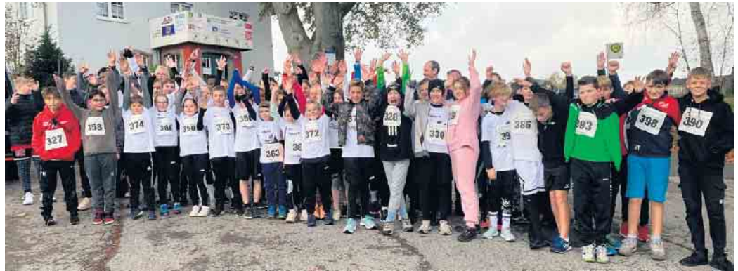
Alle Teilnehmer der Gesamtschule Marienheide vor dem Start.

Zum wiederholten Mal nahm die Gesamtschule Marienheide am Samstag, 05.11.2022 am Herbstwaldlauf durch den Gervershagener Forst entlang der Bruchertalsperre teil, der zum 45. Mal von der Skiabteilung des TV Rodt Müllenbach veranstaltet wurde. Die Gesamtschule beteiligte sich an dem 3,4 km langen Rundweg um die Brucher mit mehr als 70 aktiven Läufern aus allen Sportklassen. Gestartet wurde bei