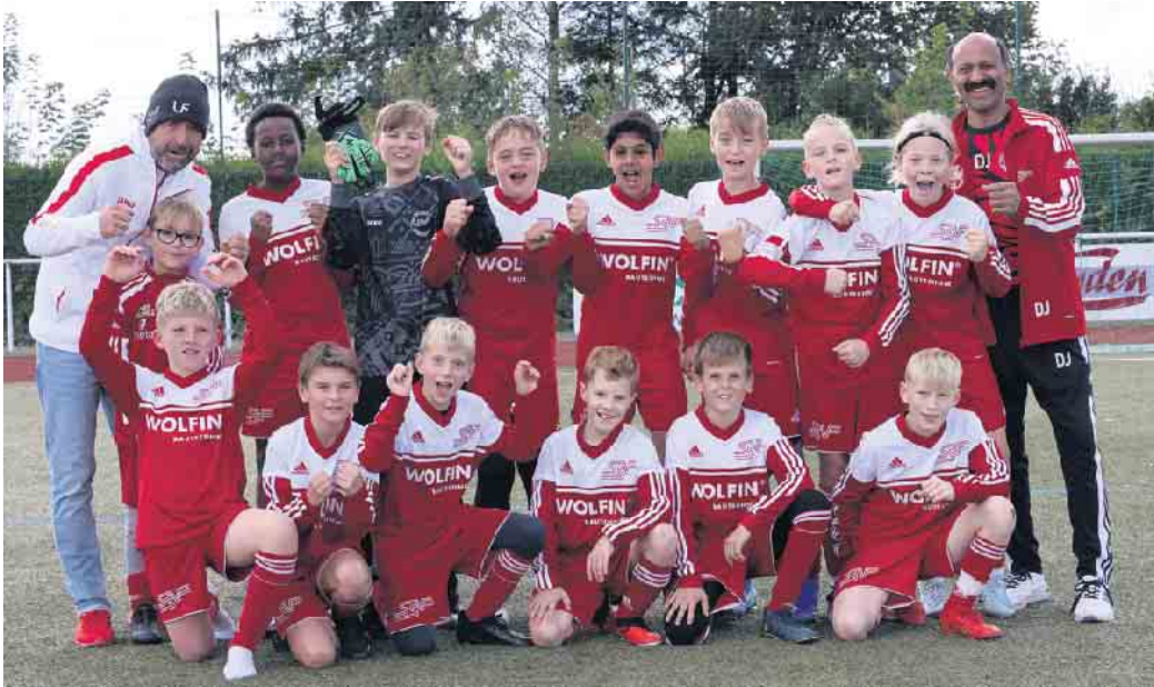
Die DU12-Jugend des SSV Marienheide.

Der SSV Marienheide ist mehr als ein Sportverein - er ist eine Gemeinschaft, in der sportliche Herausforderungen und neue Freundschaften zusammenkommen. Durch das gemeinsame Fußballspielen entsteht ein starkes Zusammengehörigkeitsgefühl, das unsere Teams verbindet und über das Spielfeld hinaus soziale Bindungen stärkt.