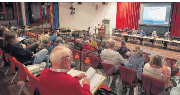
Großes Interesse gab es bei der Info-Veranstaltung der Ehrenamts-Akademie Oberberg zur Vereinshaftung in Radevormwald.