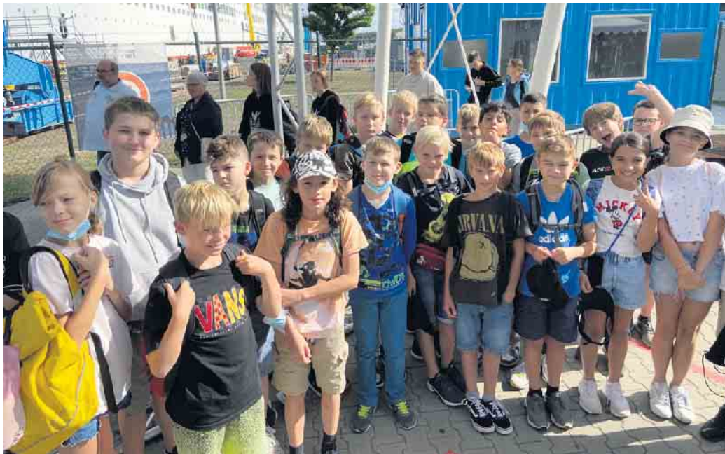
Der Großteil der 6d beim Besuch in Papenburg

Vom 28. August bis zum 2. September fuhren unsere Klassen 6d und 6e der Gesamtschule Marienheide mit ihren Tutoren nach Papenburg ins Jugendgästehaus. Dort angekommen bezogen wir unsere tollen Zimmer, weil sie ein Bad mit Dusche und eine separates WC hatten. Im Hinterhof des Jugendgästehauses entdeckten wir schnell ein Basketball- und ein Fußballplatz, Tischtennisplatten und einen kleinen Kletterparcours. Am Nachmittag gingen wir in die Stadt. Nach einem guten Frühstück besichtigten wir am Dienstagvormittag die Meyer-Werft und schauten uns viele Miniaturschiffe an und sahen das neue und sehr große Kreuzfahrtschiff Arvia. Am nächsten Tag machten wir mit unseren Zimmergruppen eine zweistündige Stadtrally und sahen viele alte Schiffe und Schleusen. Am Nachmittag unternahmen wir dann eine Moorwanderung. Es war echt cool und