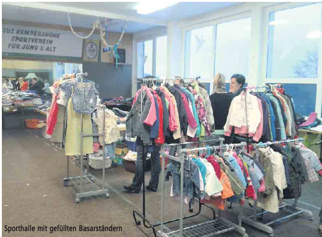
Sporthalle mit gefüllten Basarständen