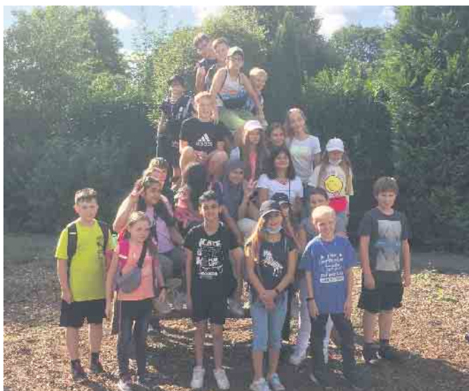
Die 6e der Gesamtschule Marienheide bei der Moorwanderung