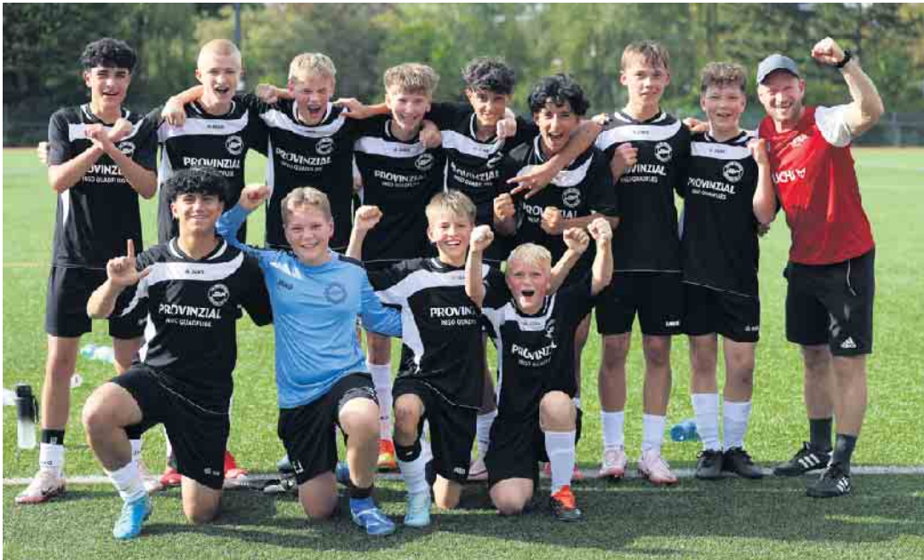
Die C-Junioren U15 des SSV Marienheide.

Der SSV Marienheide bietet Kindern und Jugendlichen die Chance, sich sportlich und persönlich weiterzuentwickeln. Egal, ob Anfänger oder erfahrener