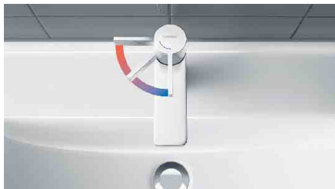
Die energiesparende FreshStart-Funktion bei Einhebelmischern sorgt dafür, dass die Beimischung von Heißwasser erst erfolgt, wenn der Hebel bewusst nach links bewegt wird.

gen bis zu 70 Prozent. Angenehmer Nebeneffekt sind die bessere Hygiene und Reinigungsfreundlichkeit der Armatur. In den Fachausstellungen des Großhandels und beim SHK-Fachhandwerk sind viele weitere Ideen rund ums Energiesparen im Bad zu sehen. In den Bad-Profis finden sich hier auch die richtigen Ansprechpartner für individuelle Fragen und für eine Umsetzung der Ideen im eigenen Badezimmer. (akz-o)