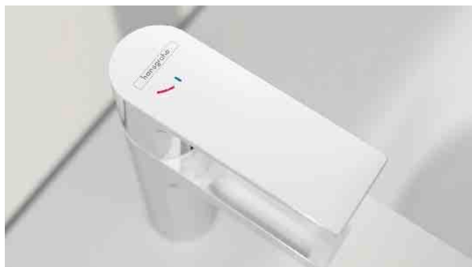
Wasserspar-Kartuschen in Einhebelmischern bewirken einen Widerstand im Hebelweg, der verhindert, dass der Hebel gleich bis zum Anschlag öffnet und mehr Wasser fließt als nötig.