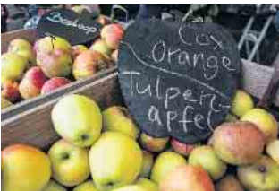
Apfelsortenschau beim Obstwiesenfest im LVR-Freilichtmuseum Lindlar.

Am Sonntag, den 6. Oktober 2024 findet im LVR-Freilichtmuseum Lindlar zwischen 10 und 18 Uhr wieder das Obstwiesenfest statt. Ein Tag rund ums Obst