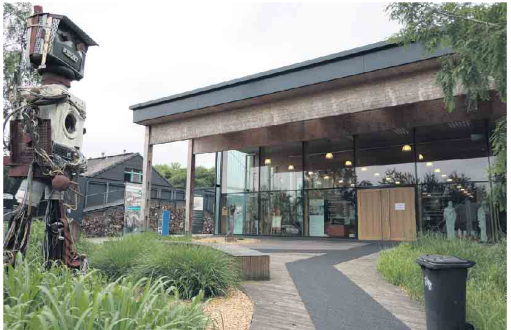
Im Energiekompetenzzentrum auf :metabolon informieren Fachleute über das richtige Heizen mit Holz.

Oberbergischer Kreis. Zum Beginn der Heizsaison lädt der Oberbergische Kreis zu einer Informationsveranstaltung zum Thema „Richtig Heizen mit Holz“ ein. Die Veranstaltung findet in Kooperation mit Wald und Holz NRW, der Schornsteinfegerinnung, dem Rheinisch-Bergischen Kreis und :metabolon statt. Am Donnerstag, 10. Oktober, von 18 bis 20 Uhr, auf :metabolon in Lindlar. Die Organisatoren wollen mit diesem Angebot das Bewusstsein für die Nutzung der Ressource Holz schärfen und wertvolle Tipps für ein effizientes und umweltschonendes Heizen vermitteln. Ofenbesitzerinnen und Ofenbesitzer haben die Gelegenheit, von den Fachkenntnissen der Expertinnen und Experten zu profitieren. Dabei gibt es spannende Beiträge von Wald und Holz NRW zum Thema „Ressource Holz“ sowie aktuelle Informationen zu „Gesetzesneuerungen für Einzelfeuerstellen“ von der Schornsteinfeger-Innung Köln. Im Anschluss wird eine Fragerunde angeboten. In die Praxis geht es dann bei einer Heizvorführung