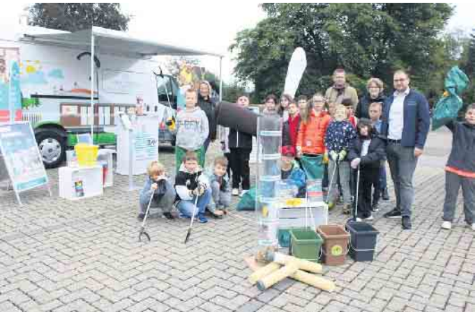
Müllsammelaktion im Ortskern

Exkurs Zigarettenstummel: Bereits eine Zigarette kann bis zu 1.000 Liter Wasser mit einer zu hohen Nikotinbelastung verunreinigen. Ein einziger Zigarettenstummel kann 40 bis 60 Liter Wasser vergiften. Darüber hinaus benötigen die Zigarettenstummel 10 bis 15 Jahre, bis sie verrotten. Das Highlight der Klimawoche war der Eventtag am Sonntag, dem 08. September, auf dem Heier Platz. Das Programm mit Stadtfestcharakter zog über 500 Besucherinnen und Besucher in den Ortskern. Über 30 Stände informierten über verschiedene Umweltthemen mit besonderem Fokus auf Klimaschutz und Mobilität oder dienten der Unterhaltung. Auch die jüngeren Bürgerinnen und Bürger kamen dabei auf ihre Kosten. Dafür