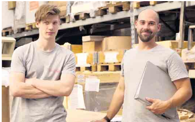
Viele Nachwuchskräfte kommen über ein Praktikum zu ihrem Beruf als Ofen- und Luftheizungsbauer.

Kleinbetrieben, die Kachelöfen individuell nach Kundenwünschen errichten. Mit etwas Berufserfahrung kann man seinen Meister machen, Fach- und Führungsaufgaben übernehmen und im Betrieb aufsteigen. Oder man wagt mit dem Meistertitel die Selbstständigkeit. Eine Weiterbildung als Techniker in der Fachrichtung Heizungs-, Lüftungs-, Klimatechnik ist ebenso möglich. Und ein nachfolgendes Bachelor-Studium im Studienfach Versorgungstechnik eröffnet weitere Karrierechancen. Einen #ofenhelden Infotalk findet man kostenfrei unter https://wir-sind.ofenhelden.info . Ofenbauer informieren hier über ihren abwechslungsreichen Beruf. Wer ihn kennenlernen