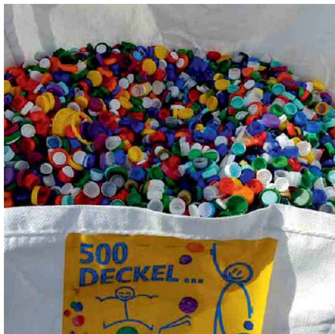
„Deckel gegen Polio“ geht weiter. Abgabe an den Wertstoffhöfen.

Einer der wichtigsten Unterschiede zwischen Ein- und Mehrwegbehältern ist ihre Wiederverwendbarkeit. Während Einwegverpackungen nur einmal genutzt und dann recycelt werden, können Mehrwegbehälter aus Glas oder PET wiederverwendet, also gereinigt und neu befüllt werden.