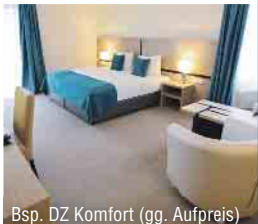
Bsp. DZ Komfort (gg. Aufpreis)