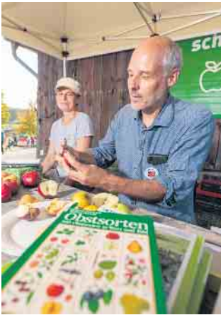
Obstsortenbestimmung durch den Pomologen beim Obstwiesenfest im LVR-Freilichtmuseum Lindlar.

unter anderem Tipps zum Obstbaumschnitt. Für das leibliche Wohl sorgen regionale Gastronomiestände. Äpfel, Birnen und Quitten aus eigener Ernte können mitgebracht und in einer mobilen Saftpresse zu Saft verarbeitet werden. Dafür ist in diesem Jahr die mobile Mosterei von Most & Trester zu Gast. Auf der Homepage der Mosterei kann man sich über das Buchungssystem anmelden. ( anny.co/b/most-und-trester/services ) Obstwiesenfest im LVR-Freilichtmuseum Lindlar Sonntag, 6. Oktober, 10 bis 18 Uhr Information: 02234 9921-555, www.freilichtmuseum-Lindlar.lvr.de