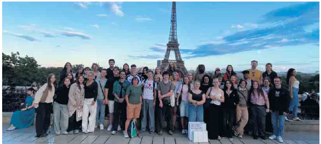
Schülertruppe vor dem Eiffelturm.