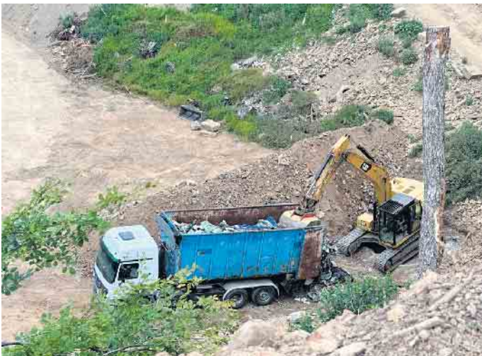
Mit schwerem Gerät wurde in Kotthausen Abfall illegal vergraben

Ende: Aus der Arbeit der Parteien Bündnis90 / Die Grünen