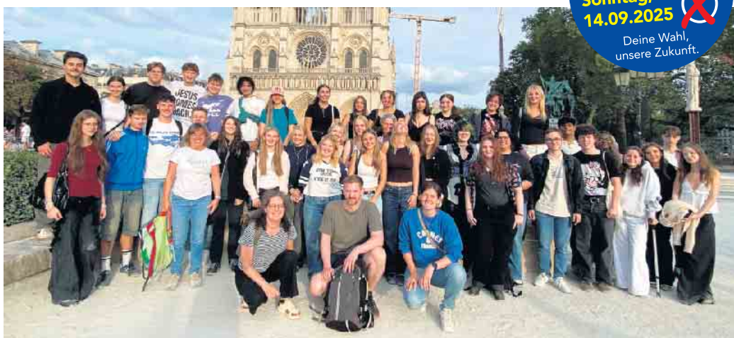
Gesamtschüler vor der Kathedrale Notre Dame.