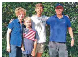
Gastfamilien schenken Austauschschüler/innen ein Zuhause auf Zeit.

wahr! Und es entsteht ein neues Zuhause fernab der Heimat, das in Erinnerung bleibt. Bevor sie ein Gastkind bei sich aufnehmen, machen sich viele Familien Gedanken. Kann man wirklich eine fremde Person in den Kreis der Familie aufnehmen? Wird sie sich wohlfühlen? Wie kann man Probleme ansprechen? Viele Gastfamilien berichten jedoch, dass diese Bedenken rasch verfliegen sind. Denn die Verbindung und Zuneigung zum Gastkind entstehen oft schon nach kürzester Zeit - ehe man sich versieht, fühlt es sich wie ein eigenes Kind an. Die Organisation betreut die Familien bei Fragen und stellt zudem eine ehrenamtliche Ansprechperson aus der Region bereit. Das Besondere: Mit Experiment können fast alle Gastfamilie werden! Egal ob auf dem Land oder in der Stadt, ob alt oder jung, ob Klein- oder Großfamilie. Entscheidend ist die Freude an Vielfalt und an kulturellem Austausch. Und der Wille, Zeit mit dem Gastkind zu verbringen und ihm zu zeigen, wie das Leben in Deutschland aussieht. Interessierte Familien finden unter www.experiment-ev.de/gastfamilie werden ausführlichere Informationen. (akz-o)