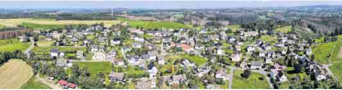
Luftaufnahme vom Dannenberg

Das Dorfgemeinschaftshaus und das Dorf feiern ihre Geburtstage