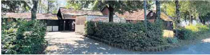
Herzlich Willkommen im Dorfgemeinschaftshaus!