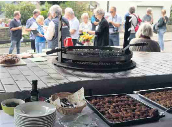
Der Grillplatz ist mit Backes und Dorfbrunnen ein beliebter Treffpunkt für alle Generationen in Schönenborn.