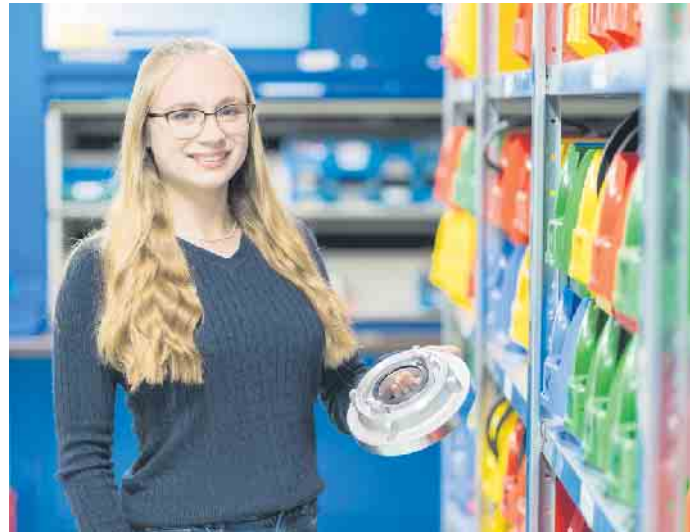
Kaufleute für Groß- und Außenhandelsmanagement sorgen für einen reibungslosen Warenfluss.

Kaufleute für E-Commerce betreuen Onlineshops, entwickeln Marketingmaßnahmen, analysieren Prozesse und vieles mehr. Auch im Technischen Handel wächst der Onlinebereich kreativ und dynamisch - ein Zukunftsberuf für PC- und Internetfans. (akz-o)