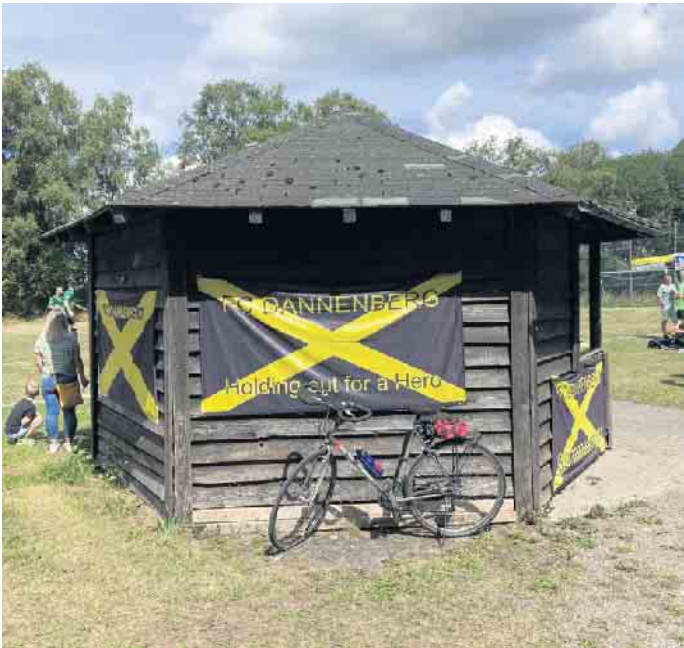
Die schwarz-gelben Fahnen wehen wieder in den Highlands Oberbergs

(E-Mail: st.linden@fug-linden.com ). Mit sportlichen Grüßen FC Dannenberg