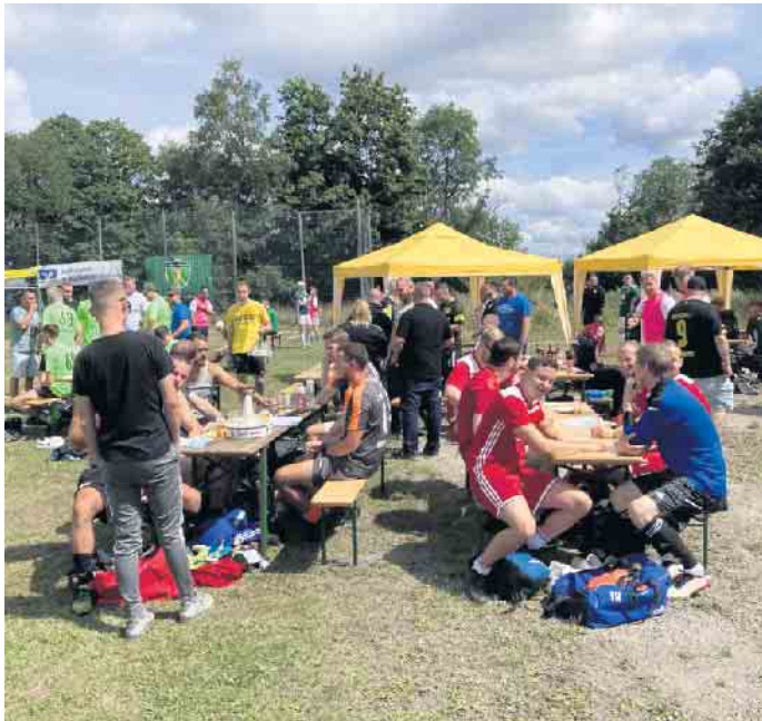
Beste Stimmung bei den Turnier-Gastmannschaften