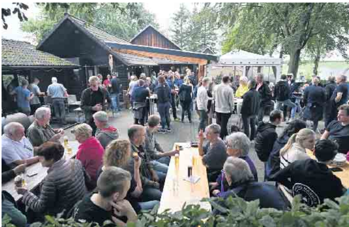
Fröhliches Beisammensein beim Dorffest in Dannenberg

Kinderbelustigung, Gaukler, Musikzug, Eiswagen und Dämmerschoppen erstmals an einem Tag