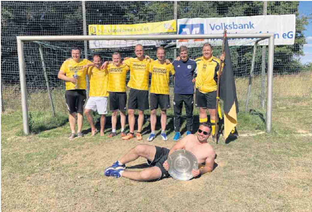
Der FC Dannenberg geht als Titelverteidiger in das diesjährige Turnier

Am Samstag, 31. August veranstaltet der FC Dannenberg ab 10 Uhr (Turnierbeginn - Eröffnungsspiel) sein 24. Kleinfeld-Fußballturnier auf dem Rasenplatz „Heednocken“ hinter dem Dorfgemeinschaftshaus Dannenberg / neben dem Osterfeuerplatz. Die teilnehmenden Mannschaften (Torwart und fünf Feldspieler / fliegende Wechsel) kommen überwiegend aus den umliegenden Ortschaften, sodass es wieder zu einigen heißen Derbys kommen kann. In diesem Jahr wird wieder die Meisterschale als Wanderpokal ausgespielt, wobei der Titelverteidiger (FC Dannenberg) natürlich erneut mit von der Partie ist und alles geben wird, damit am Ende wieder die schwarz-gelbe Vereinsfahne als Siegesbanner wehen und der Dannenberger Schlachtruf durch die „Highlands Oberbergs“ tönen wird. Die drei besten Teams werden mit Pokalen ausgezeichnet, zudem wird der „Schluckspecht-Pokal“ und der Pokal für den besten Torwart des Turniers vergeben. Für Essen und Trinken ist bestens