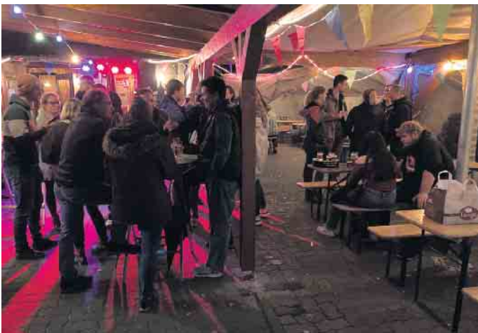
Der Dämmerschoppen geht bis in die tiefe Nacht