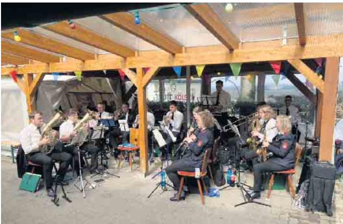
Der Musikzug der Freiwilligen Feuerwehr Marienheide sorgt für hervorragende Stimmung

Wir freuen uns darauf euch als unsere Gäste begrüßen zu dürfen!