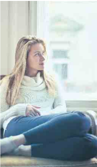
Lüftungssysteme mit Wärmerückgewinnung regeln automatisch den notwendigen Luftaustausch, wärmen die Frischluft vor und sparen Heizkosten.

Unter www.wohnungs-lueftung.de gibt die Initiative „Gute Luft“ mehr Informationen zur modernen Technik und den Fördermöglichkeiten. Lüftungssysteme regeln automatisch den notwendigen Luftaustausch, ohne dass die Fenster geöffnet werden müssen. Dadurch wird verhindert, dass die Räume im Winter durch manuelle Fensterlüftung schnell auskühlen und langsam und teuer wieder aufgeheizt werden müssen. Lüftungsgeräte mit Wärmerückgewinnung dagegen geben beim Abführen der verbrauchten, warmen Raumluft die Wärme an einen Zwischenspeicher, den Wärmetauscher, ab. Strömt anschließend kalte Frischluft in den Wohnraum, nimmt sie die gespeicherte Wärme wieder auf und wird so effektiv vorgewärmt. Energiesparende Technik Auf diese Weise können Lüftungssysteme bis zu 90 Prozent der Wärme aus der Abluft zurückge-