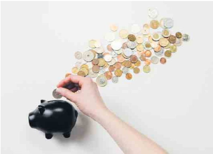
Mit energieeffizienter Haustechnik wie einer modernen Wohnraumlüftung mit Wärmerückgewinnung lassen sich wertvolle Heizkosten einsparen.

gewinnung äußerst stromsparend. Die Wohnungslüftung sorgt zudem für eine bessere Effizienz-Bewertung des Gebäudes und hebt den Wiederverkaufswert. Gerade in Neubauten oder bei der energetischen Sanierung, wenn die Gebäudehülle fast luftdicht ist, spielt die Lüftungstechnik ihre Vorteile aus. (djd)