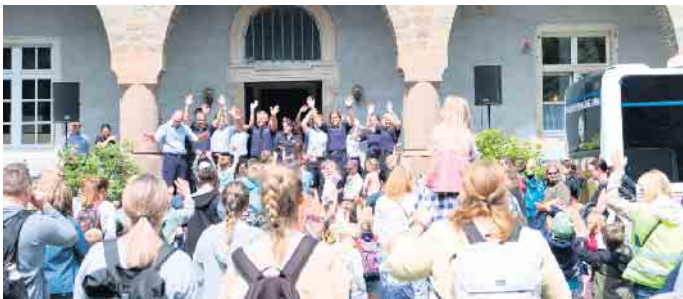
Begrüßung auf der Schlosstreppe

rückten die Straßenüberquerung in den Fokus und plädierten für das Tragen von Warnwesten und Klackbändern bei schlechtem Wetter oder in der Dunkelheit. Im Bus der Puppenbühne Unna galt es etwa, den ausgebrochenen Löwen Simba wieder einzufangen und bei dem Düsseldorfer Team hatte ein „Spuk“ das grüne Licht der Ampel ausgepustet. (mk)