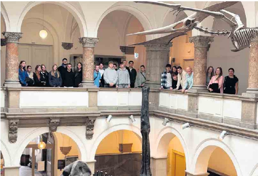
Gesamtschüler in der Ludwig-Maximilian-Universität München