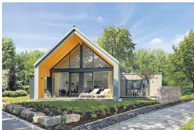
Ein auskragendes Dach schließt die Terrasse in das Gesamtbild des Gebäudes ein und schützt sie vor Witterungseinflüssen.

Mit Weitblick bei der Terrassenplanung entsteht ein erweiterter Wohnraum, der zu den Lebensgewohnheiten passt. Die Vorteile des Fertighausbaus kommen hier voll zum Tragen.