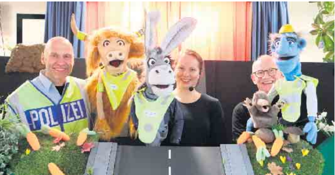
Das Team aus Bielefeld hilft bei der Straßenüberquerung