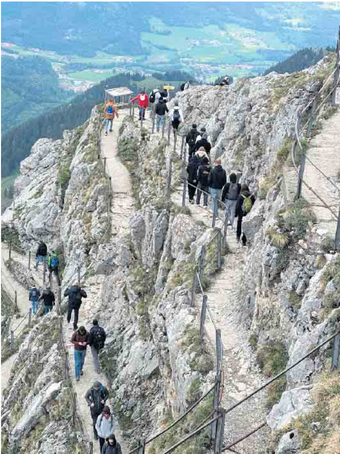
Erkunde-Kurs auf dem Wendelstein.