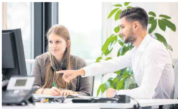
Die künftigen Vertriebstalente im Außendienst sind gefragt und die Entwicklungsperspektiven ausgezeichnet.

dem Kölner Versicherer. Diese Entscheidung hat die junge Frau nicht bereut, die Ausbildung macht ihr großen Spaß: „Ich bin stolz darauf, dass am Ende des Tages meine Kunden zu mir sagen ‚Ich vertraue Ihnen‘. Das ist ein sehr schönes Gefühl und motiviert mich“, erzählt sie. Auch die vielseitigen Ausbildungsinhalte gefallen Gizem: „Von der Kundenberatung über die Angebotserstellung bis hin zum Verkauf werden wir in vollem Umfang in die Arbeitsabläufe einbezogen.“ Die Auszubildenden haben direkten Kontakt zur Kundschaft, sie nehmen Außentermine wahr und beraten Kundinnen und Kunden auf Wunsch zu Hause. Während der gesamten Ausbildung erfah-