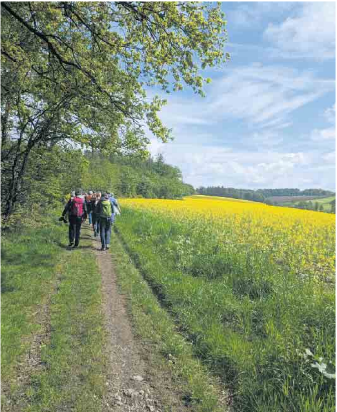
Wandern mit Weitblicken bei geführten Touren im Rahmen der Bergischen Wanderwochen.

dungen war die „Bergische 50“ bereits zweieinhalb Monate vor dem Start ausgebucht - ein Rekord für das größte Wandereignis im Bergischen Land. „Das freut uns sehr und zeigt, dass es die richtige Entscheidung war, unsere Kooperation mit den Veranstaltern auszuweiten und mit diesem bei Einheimischen sowie Menschen aus dem Um- und Ausland beliebten Wanderevent gemeinsam den Startschuss für unsere Wanderwochen zu geben“, so Wilhelm. Großes Interesse und positive Rückmeldungen Besonders beliebt im Programm der Frühjahrswanderwochen waren unter anderem Kräuterwanderungen, kulinarische Touren und spezielle Angebote für Familien. „Die überwiegende Zahl der Teilnehmer*innen kam aus