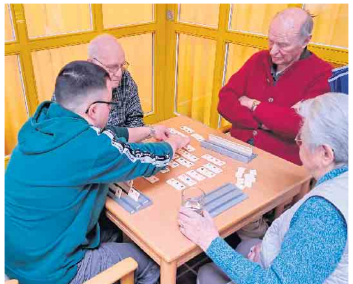
Beim Besuch im Seniorenzentrum wurde nicht nur gehäkelt, sondern auch gespielt, z.B. Rummikub.