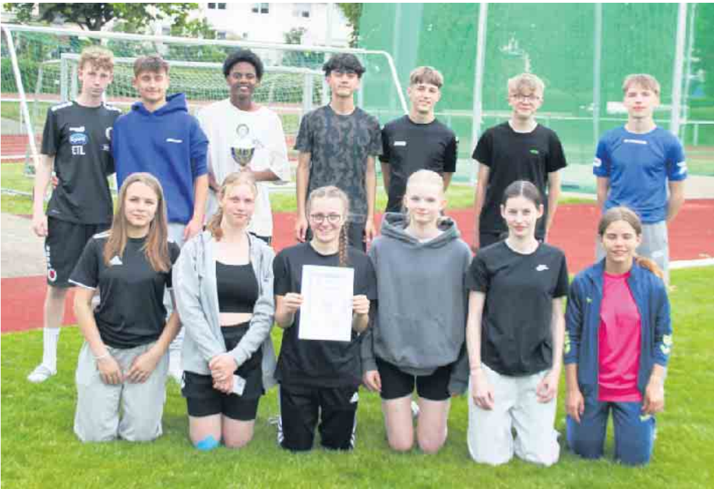
Die Leichtathletikmannschaft der Gesamtschule Marienheide nach der Siegerehrung.

Am 15. Mai fanden bei schönem, sonnigem Wetter im Bernhard-Wald-Stadion in Wipperfürth die Leichtathletik-Kreismeisterschaften im Rahmen von „Jugend trainiert für Olympia“ statt, an denen in der Wettkampfkategorie III neben einer Mannschaft der Gesamtschule Marienheide auch Mannschaften vom Lindengymnasium Gummersbach sowie vom Engelbert-vom-Berg-Gymnasium und vom St. Angela-Gymnasium aus Wipperfürth teilnahmen. Die