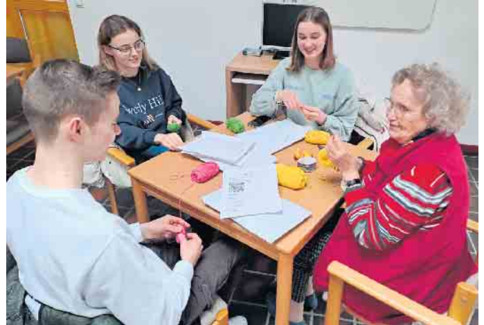
Nicht nur das Häkeln sondern auch der gemeinsame Austausch zwischen den Projektteilnehmer*innen und den Senior*innen waren wichtig.

Neun Schülerinnen und Schüler aus den Jahrgängen 9, 10 und Q1 haben in Kooperation mit der „youngcaritas“ Oberberg und dem Mehrgenerationenhaus Marienheide gemeinsam mit Seniorinnen und Senioren „Trostbärchen“ für das Kreiskrankenhaus Gummersbach gehäkelt. Während der Häkel-Treffen herrschte eine entspannte Atmosphäre: Gespräche und gegenseitige Unterstützung, aber auch mal eine Pause bei einer Cola, einem Kaffee und einem Stück Kuchen oder einem gemeinsamen Gesellschaftsspiel, denn das Häkeln erfordert Geduld und Konzentration. „Ein schönes Projekt