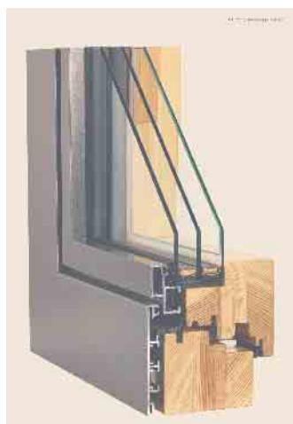
Das Beste zweier Welten miteinander verbinden: Querschnitt durch einen Holz-Aluminium-Fensterrahmen. Copyright Terhalle

Bei extremen Außentemperaturen schützt eine Aluminium-Verschallung zudem vor großer Erhitzung des Kunststoffs. Die Witterungsbeständigkeit von Aluminium ist auch bei Holz-Aluminium-Kombinationen ein Pluspunkt. Sie gelten als sehr wartungsarm da eine mögliche Nachbehandlung des Holzes durch Streichen entfällt. Wer auf Holz-Behaglichkeit im Innern und architektonische Moderne nach außen setzt, für den mögen Holz-Aluminium-Kombinationen genau das Richtige sein - mit