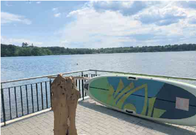
Seebalkon als Aufenthaltsfläche

und den Erfolg des neu entstandenen touristischen Highlights an der Brucher-Talsperre war die enge Zusammenarbeit zwischen den beteiligten Partnern. Dies sind die Projektgesellschaft, die Tourismusorganisation „Das Bergische“, die das Angebot proaktiv in die Bewerbung überführt, die Gemeinde Marienheide, der Wupperverband, zahlreiche Betriebe und weitere engagierte Akteure. Durch diese Partnerschaft konnte ein barrierefreies und inklusives „Erlebnis für alle“ gelingen. Die Nachfrage nach Angeboten für ältere Menschen und Menschen mit körperlichen Beeinträchtigungen steigt kontinuierlich und die Tourismusorganisation Das Bergische reagiert darauf, um den Bedürfnissen dieser Zielgruppe gerecht zu werden. Die neuen barrierefreien Angebote sind eine ideale Bereicherung für das Vermarktungsportfolio und sorgen zudem für Wachstum im Wirtschaftssektor. Die Partner sind sich einig, dass man die Arbeit unter der Marke „Das Bergische barrierefrei“ fortsetzen wird und das Thema Inklusion mit der Realisierung der beiden touristischen Angebote in Marienheide und Altenberg erst ein Anfang ist.