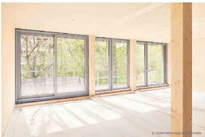
Lichtdurchflutete Räume, eingerahmt von eleganter Metall-Optik: Fensterrahmen aus einem Aluminium-Holz-Verbund bieten viele Gestaltungsmöglichkeiten gerade für großformatige Fenster.

zahlreiche Objekte, die sich mit Aluminium-Rahmen besonders gut realisieren lassen. Aluminium bietet auch eine große Oberflächenvielfalt, die sich mit verschiedenen Pulver- oder Nasslackbeschichtungen sowie in Eloxaloberflächen erreichen lässt.