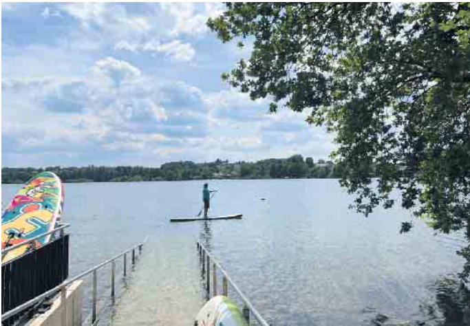
Stand-up-Paddling auf der Brucher dank barrierefreiem Wasserzugang