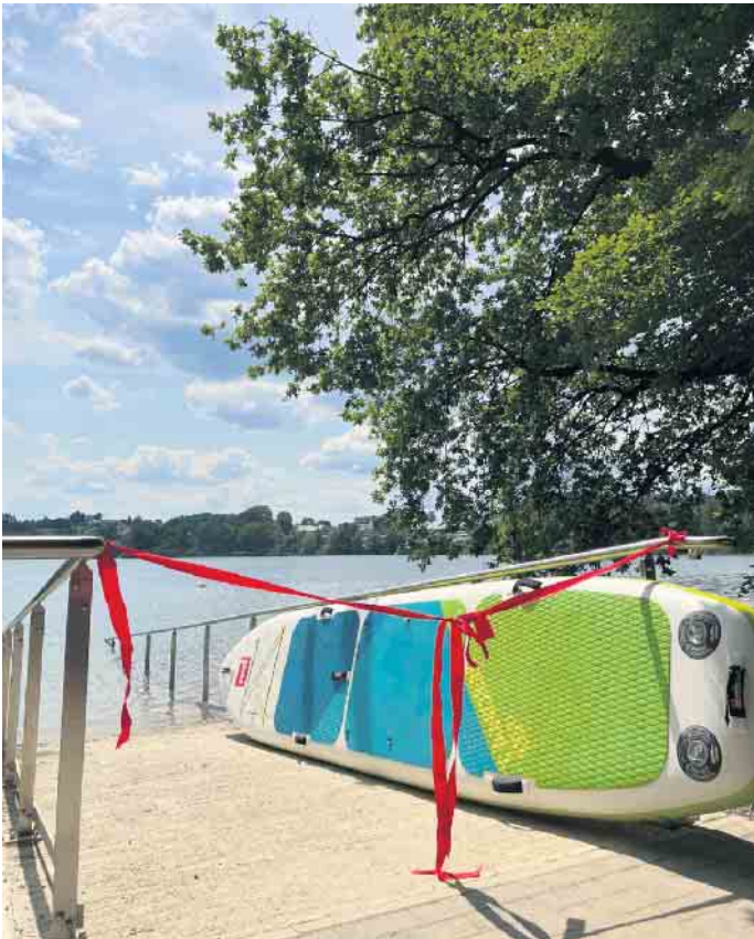
Rampenanlage als barrierefreier Wasserzugang