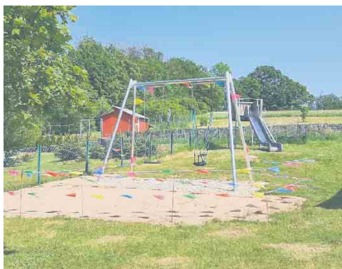
Spielplatz Schöneborn.

Kreissparkasse Köln. Nun konnte man starten. Nach Bestellung und Lieferung der neuen Schaukel konnte mit der Planung des Aufbaus begonnen werden. Hierbei wurde die Hofgemeinschaft sehr konstruktiv von den Mitarbeitern des Bauhofes der Gemeinde unterstützt. Abbau der alten Schaukel und entfernen der Betonfundamente mittels Minibagger waren schnell erledigt, sowie den neuen Fallschutz in Form von Holzhackschnitzeln einzubauen wurde von den freundlichen Männern des Bauhofes übernommen. Das hat den Schöneborner Männern viel schweißtreibende Arbeit erspart. Es bleibt das Aufstellen und einbetonieren der neuen Schaukel, welches durch die tatkräftige dörfliche Zusammenarbeit problemlos gemeistert wurde. Ein herzlicher Dank gilt also der Jury die die Finanzierung durch die Zuteilung des Förderbetrages