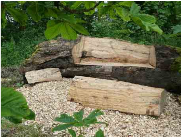
Die Sitzecke "Im Broich"