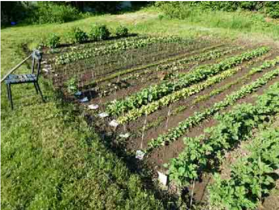
Hier wächst es im Frühjahr und Sommer