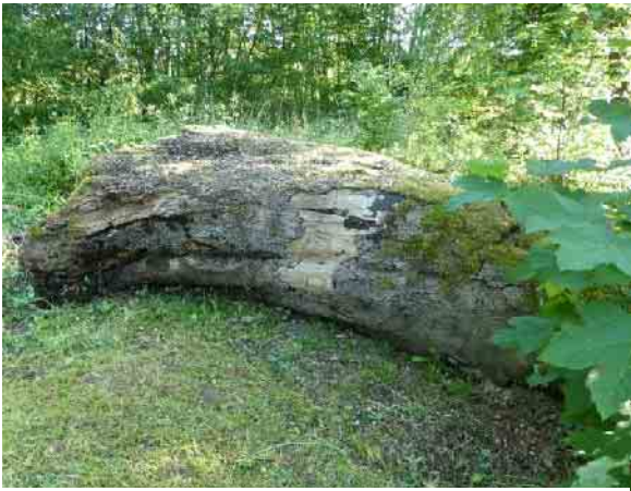
Auch so kann ein Baumstamm genutzt werden