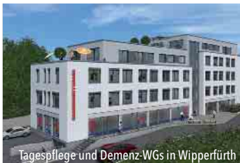
Tagespflege und Demenz-WGs in Wipperfürth