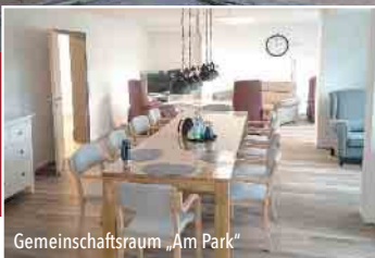
Gemeinschaftsraum „Am Park“