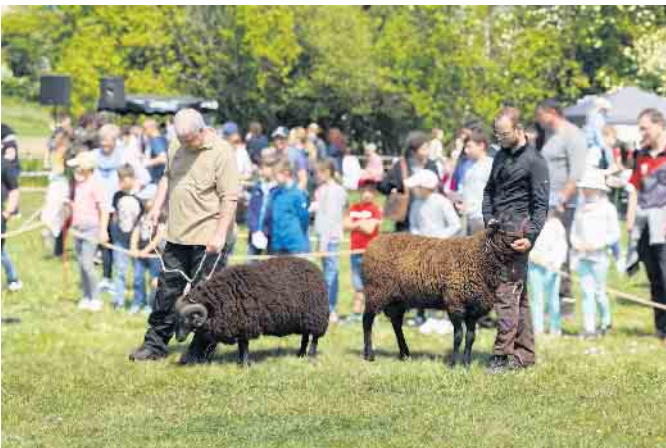
Die Vorführungen bei der Veranstaltung „Tierkinder“ sind ein Publikumsmagnet.

Das besondere Highlight bei der Veranstaltung „Tierkinder“ sind die Jungtiere der alten Haustierrassen.