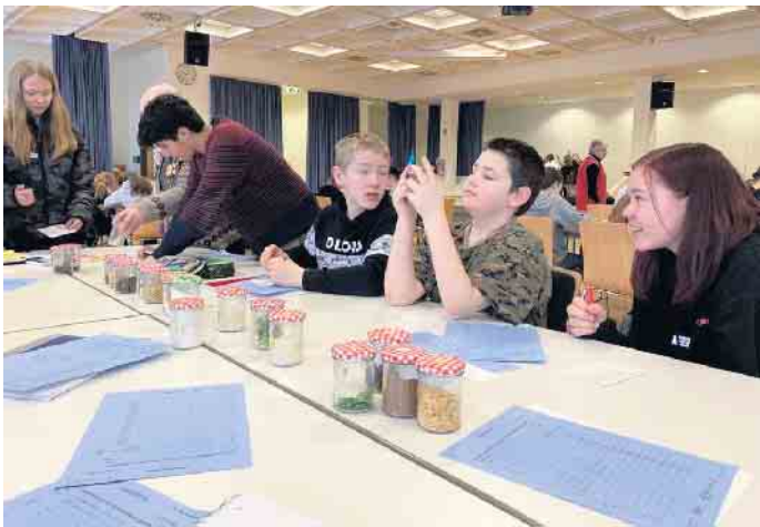
Auch der Umgang mit bzw. die Analyse verschiedener Lebensmittel wurde geprobt.