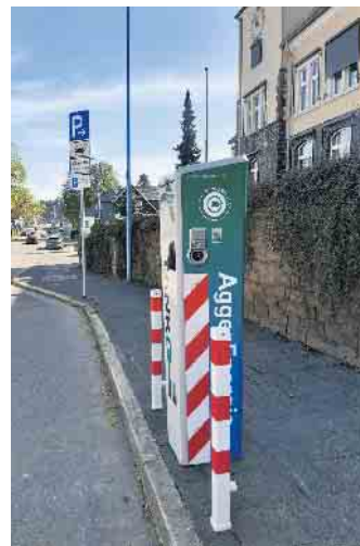
Ladesäule vor dem Rathaus/Hauptstraße

Mit den gesamten Ladevorgängen dieses Zeitraums wurde eine Fahrleistung von 12.700 Kilometern erreicht. Die Emissionsreduzierung, die auf dieser Strecke im Vergleich zu einem konventionellen Pkw entstand, führte zu einer CO 2 -Einsparung von 1,54 Tonnen CO 2 .