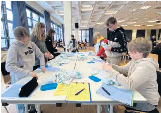
Das Falten von Handtüchern und das Verpacken stand für die Marienheider Gesamtschüler*innen auch auf dem „Arbeitsplan“.