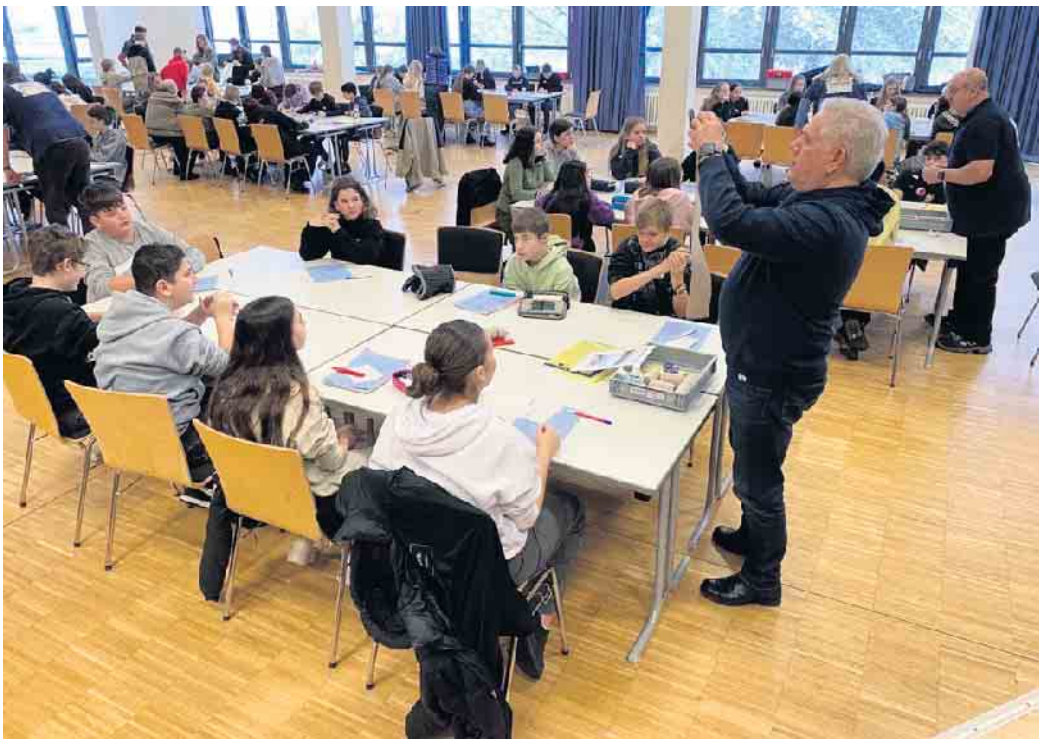
Mitglieder des Technikzentrums Minden erläutern die Aufgaben den Schüler*innen in den Tischgruppen.

Vor den Osterferien führten die über 130 Schülerinnen und Schüler des 7. Jahrgangs der Gesamtschule Marienheide einen ersten Berufserkundungstag im Rahmen der Berufsorientierung durch, bei dem sie z.T. spielerisch ihre Talente entdecken sollten. Dabei galt es typische Übungen zu machen, die in bestimmten Berufen von Bedeutung sein können, z.B. Dachpfannen werfen (Dachdecker*in), Serviceübungen in der Gastronomie (Restaurantfachkräfte), Binäre Zahlen anwenden (Fachinformatiker*in), Verpacken (Fachkraft für Lagerlogistik), Objekte anmalen (Maler*in) und vieles mehr. Insgesamt konnten so die Schüler*innen an zwölf Stationen einen ersten kleinen Zugang zum Berufsleben bekommen.