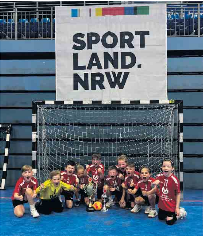
So sehen Sieger aus!