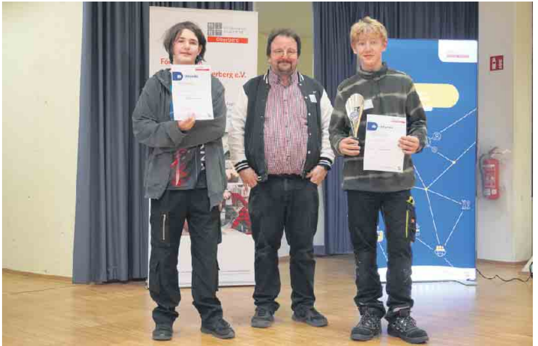
Die Gewinner des Robo-Wettbewerbs.

Premiere an der Gesamtschule Marienheide: Zum ersten Mal fand der Lokalwettbewerb „Robo-Games“ der MINT-Nachwuchsoffensive „zdi“ (Zukunft durch Innovation NRW) bei uns im PZ statt. Fünf Mannschaften sind zum Wettbewerb angetreten, u.a. das Bonhoeffer-Gymnasium Wiehl und das Engelbert-von-Berg-Gymnasium Wipperfürth sowie wir selbst als Gastgeber, alle mit jeweils einer Mannschaft.