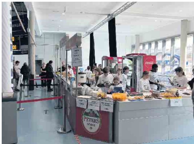
Die Sportklasse 5c der Gesamtschule Marienheide sorgte an beiden Tagen für ein hervorragendes Catering