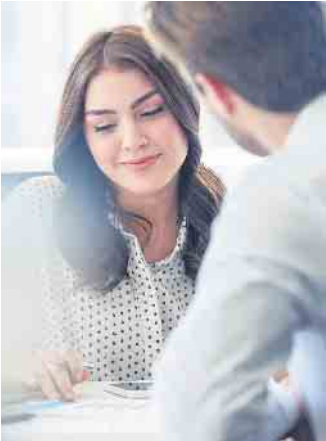
Bankkauffrau beziehungsweise Bankkaufmann zählen zu den wichtigsten Ausbildungsberufen in Deutschland.

Nachwuchskräfte im Bankwesen müssen flexibel auf Veränderungen reagieren können