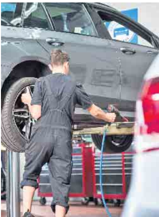
Wenn sowieso der Umstieg auf Sommerreifen ansteht, können Autobesitzer gleich einen Frühjahrs-Check in der Kfz-Werkstatt vereinbaren.

Zum Abschluss fehlt nur noch der Geruchstest: Unangenehme Gerüche aus der Klimaanlage können von einem schlecht gewarteten Filter herrühren. Besserung und ein gutes Klima im Fahrzeug verspricht