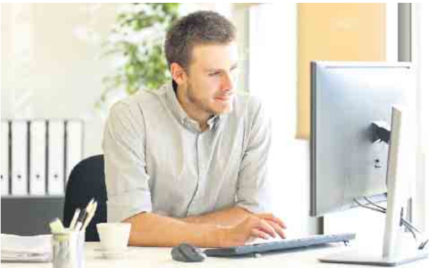
Die fortschreitende Digitalisierung verändert die Anforderungen an die Beschäftigten im Bankwesen rasant.