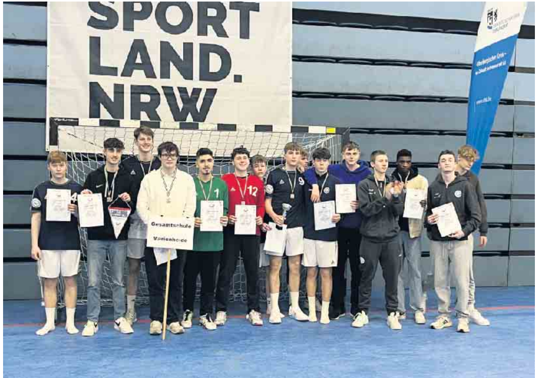
Die Jungenmannschaft der Gesamtschule Marienheide nach der Siegerehrung im Landesfinale