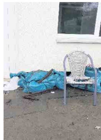
Das „Ergebnis“ der Müllsammelaktion

ben die Kinder in Marienheide Müll gesammelt. Der kommt schon mal nicht mehr ins Meer. An dieser Stelle ein Dankeschön an den BAV, der im Rahmen seiner Aktion „Gemeinsam wilden Müll sammeln“ Greifzangen und Einweghandschuhe zur Verfügung gestellt hat. Die Viertklässler haben mit Checker Tobi den Klima-Check gemacht. Leider nicht live im Flugzeug über den Bergen Bayerns, aber mit einem coolen, informativen Film. Anschließend durften die Kinder ein Quiz zum Film machen. Allen Kindern war anzumerken, dass ihnen die „Gesundheit von Mutter Erde“ ein echtes Herzensanliegen ist.