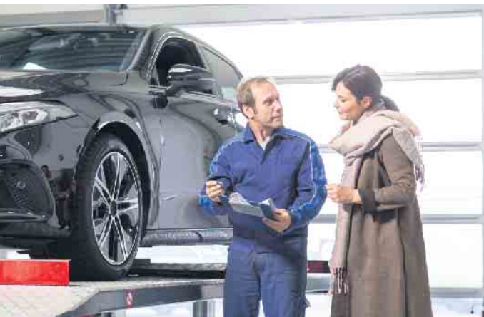
Auf der Hebebühne lassen sich die Spuren des Winters an Fahrgestell, Unterboden, Bremsen und Reifen genau unter die Lupe nehmen.

hier ein Filtertausch oder eine gründliche Desinfektion der Lüftungskanäle. (djd)