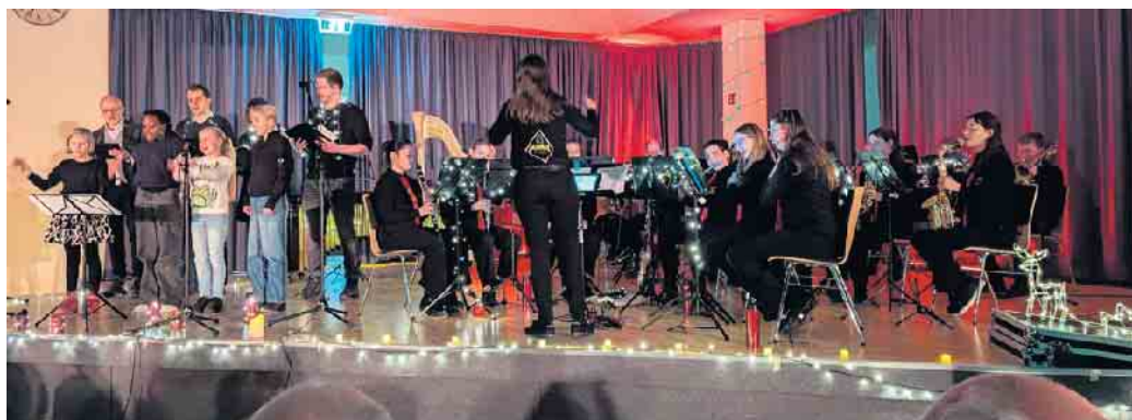
Stimmungsvolles Weihnachtskonzert der MAMBA.

Um 18 Uhr startete unser langersehntes Konzert. Das Thema des Abends lautete „Weihnachtsträume“ und wir hatten passende Lieder zu unseren Vorstellungen und Wünschen von Weihnachten auf dem Programm. Dabei handelte es sich nicht nur um traditionelle Stücke, sondern unter anderem auch um Filmmusik von „Brave“