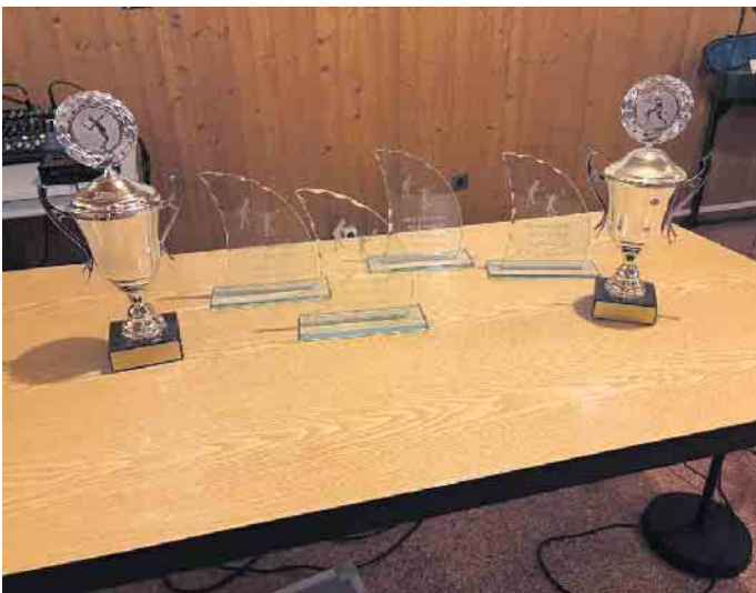
Preise der Vereinsmeisterschaft 2024