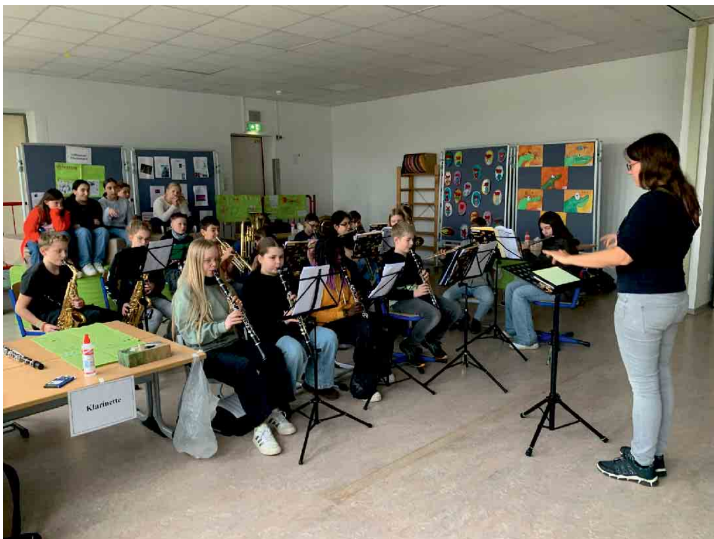
Bläserklasse 6a in der Grundschule.

Bläserklasse der Gesamtschule Marienheide unterwegs bei den jüngeren Schülerinnen und Schülern