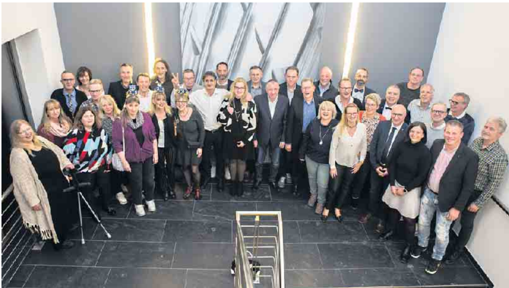
Nicht alle der 83 Neujubilarer konnten an der Ehrung teilnehmen.

In seinem anschließenden Bericht zur Lage des Unternehmens blickte der PFERD-CEO auf herausfordernde Zeiten zurück. Themen wie die Corona-Krise mit ihren Lock-Downs, der Brexit, die andauernden Störungen von Lieferketten, die Kriege in der Ukraine und in Israel, die Energieverknappung und einiges mehr, hätten das Unternehmen beschäftigt. „Aber wir erkennen heute, dass wir diese Herausforderungen haben meistern können. PFERD ist gegen den Trend vieler Branchen und entgegen der Entwicklung vieler Teile der internationalen Märkte auf einem Wachstumskurs.“ Das liege zum einen sicherlich an richtungsweisenden strategischen Entscheidungen, „vor allem aber auch daran, dass wir uns auf unsere Qualitäten und Fähigkeiten konzentriert haben und dass wir von dem,