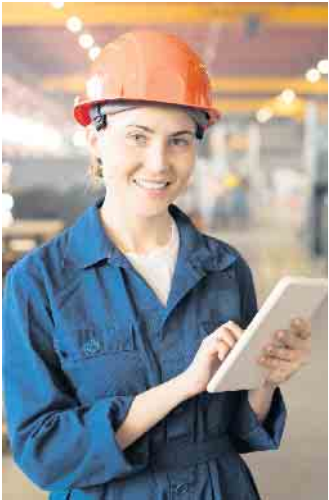
Mit einer vom Arbeitgeber finanzierten privaten Krankenversicherung können Unternehmen gut ausgebildete und motivierte junge Leute gewinnen und diese auch langfristig halten.

einer bKV besonders attraktiv sind, so stehen Zuschüsse für Zahnersatz, Behandlungen beim Zahnarzt und Sehhilfen ganz oben auf der Liste. Mehr Infos gibt es beispielsweise unter www.allianz.de/bkv . Der Großteil der Arbeitgeber wünscht sich laut infas-quo-Studie viele Wahlmöglichkeiten zu einem angemessenen Preis und individuelle, auf das Unternehmen zugeschnittene Lösungen. Die Versicherungswirtschaft hat darauf reagiert und bietet passgenaue Lösungen an. (djd)