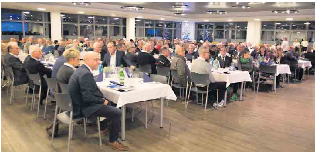
Über 250 Gäste waren zur Jubilarfeier in das PFERDBISTRO gekommen.