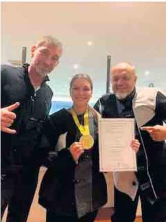
Bundesmeisterin im 3-Stellungskampf 2025

sere Mannschaft den dritten Platz und wir stellen in diesem Jahr die Bundesmeisterin. Hierauf sind wir besonders stolz.