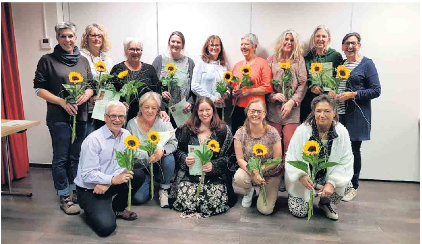
Die neuen Hospizbegleiter des amb. Hospizdienstes Much

Die beiden Koordinatorinnen freuen sich, aktuell 45 Ehrenamtliche an ihrer Seite zu wissen, um diese als Unterstützung schwerstkranker und sterbender Menschen in deren Zuhause oder in Pflegeeinrichtungen einbringen zu können.