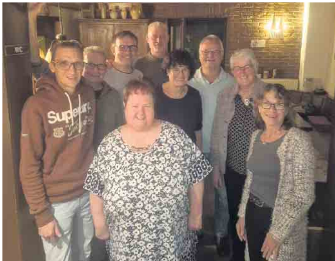
Der neue Vorstand