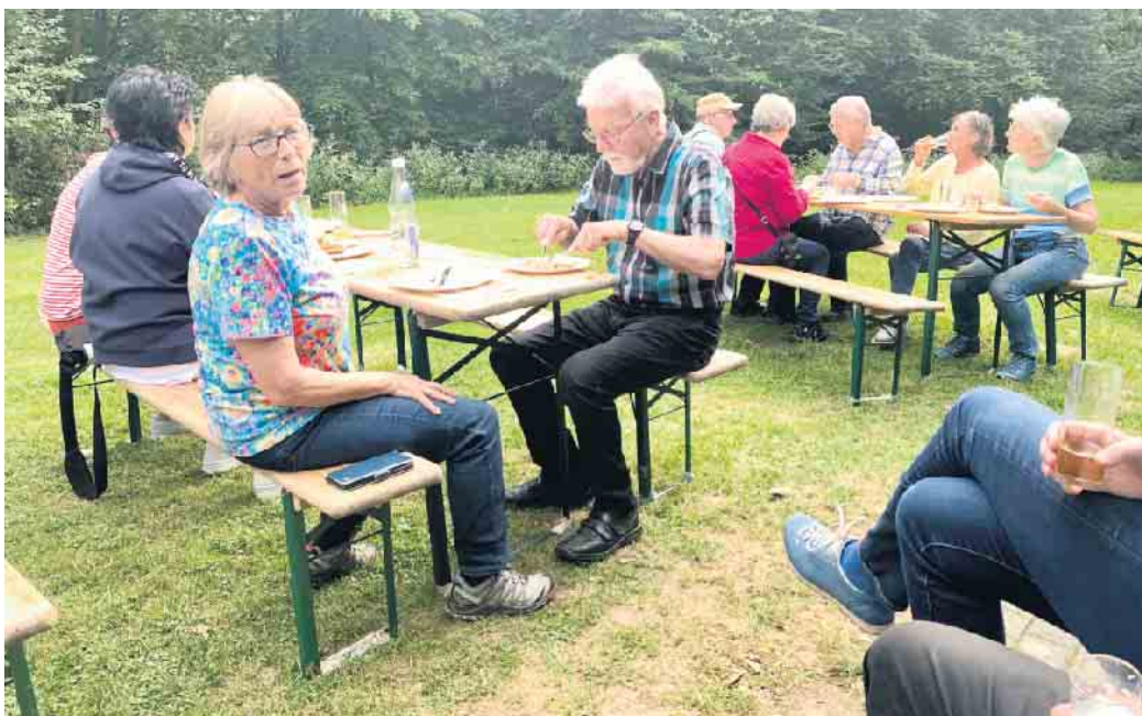
Schönes Wetter, gute Stimmung.