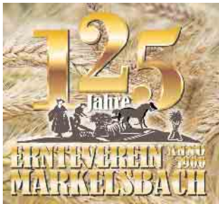
125-jähriges Jubiläumslogo (Grafik W. Twardy)

das allseits bekannte Wurstran-ten den Familientag kurzweilig gestalten. -Für den Vorstand- Thorsten Haas