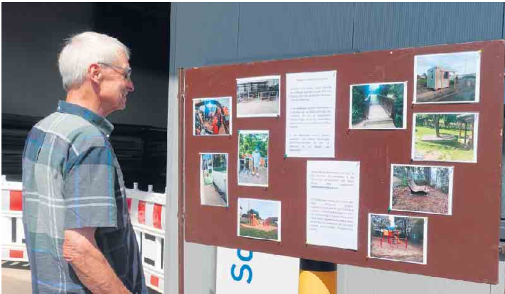
Es wurde breit informiert.