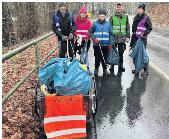
Dorfgemeinschaft Scheid

Mehrere Gruppen waren in unterschiedlichen Ortsteilen unterwegs. Während einige bereits seit vielen Jahren teilnehmen, waren auch neue Initiativen erstmals dabei.