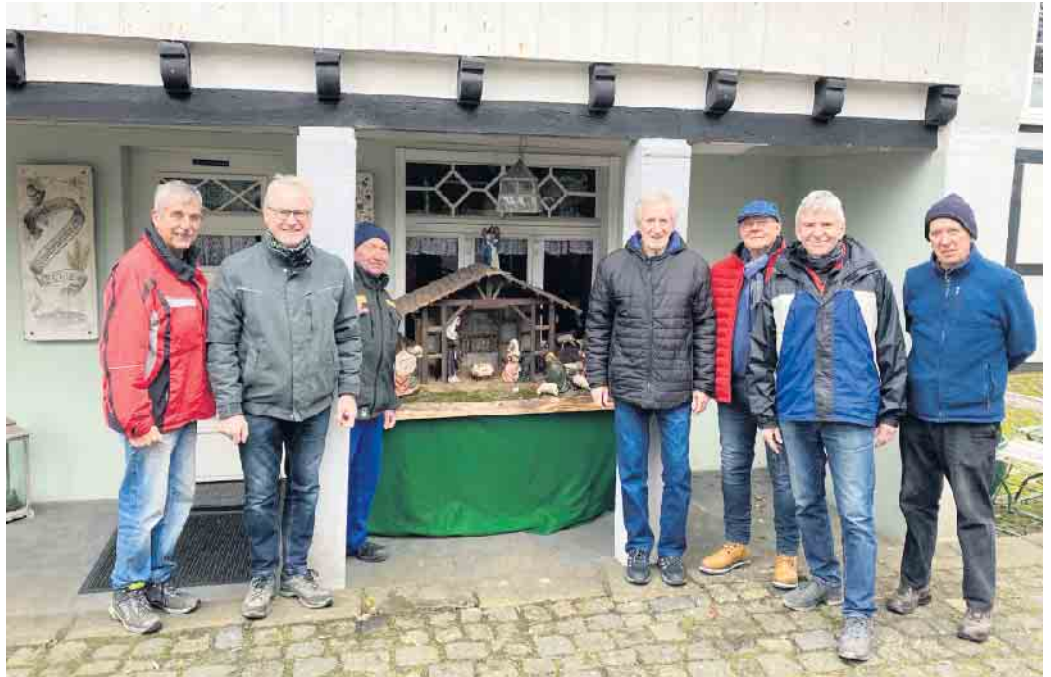
Ein Großteil des ehrenamtlichen Krippenteams.

Sehr geschätzt wurde auch in diesem Jahr die große orientalische Krippe in der Remise an der Burg Overbach. Sie war an jedem Wochenende personell von Ehrenamtlern und zeitweise von Mitarbeitern der Tourist-Information besetzt, sodass Besucherinnen und Besucher persönlich empfangen, informiert und betreut wurden. Außerhalb der Wochenenden wurden ebenfalls Besuchergruppen empfangen. Die Ehrenamtler vereinbarten hierfür individuelle Termine mit den Interessierten.