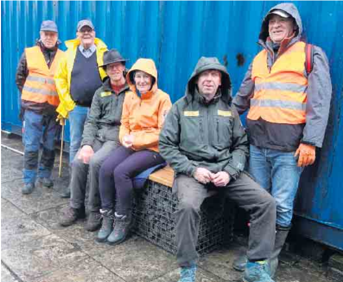
Vor dem Einsatz die neue Bank getestet.

Dieser Tag hat eine lange Tradition. Aber so ein mieses Wetter war lange nicht. Trotzdem waren viele