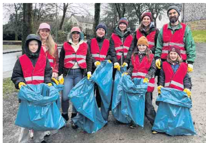
Ortsverband Die Linke