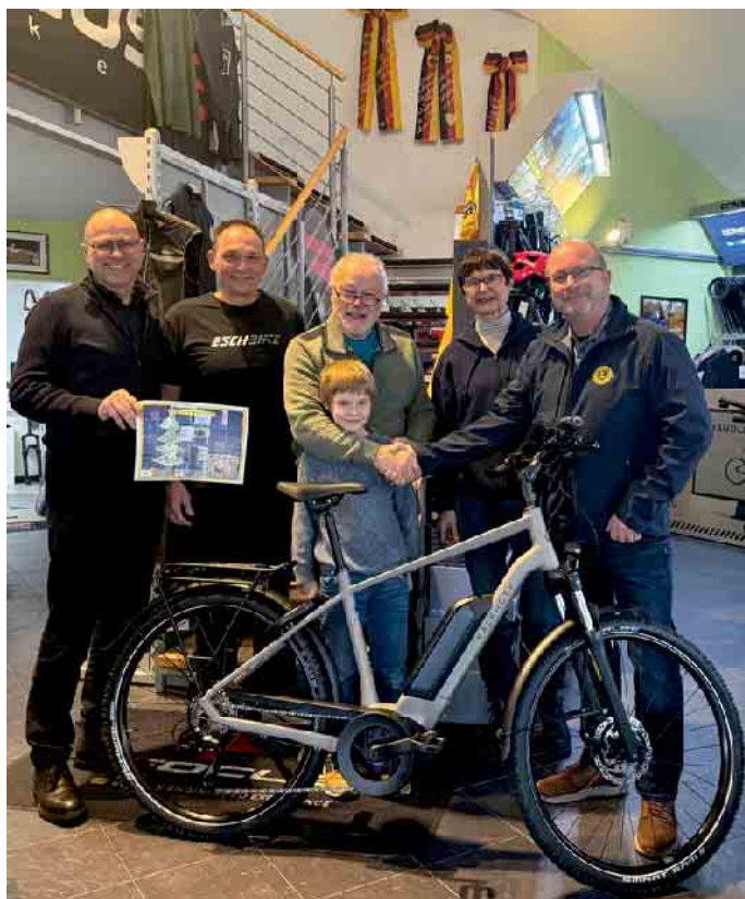
Der glückliche Gewinner des E-Bikes

Lions Club übergab Hauptpreis des Adventskalenders im Wert von 3.000 Euro