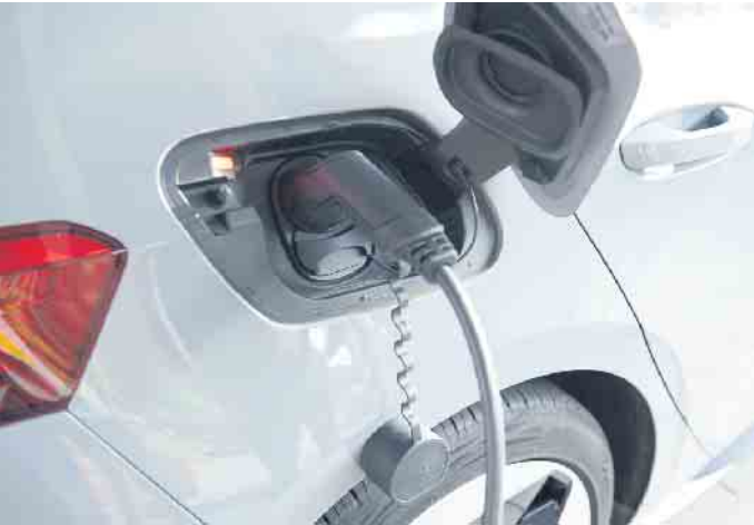
Anschluss in beide Richtungen. Beim bidirektionalen Laden dient die Batterie des E-Autos als zusätzlicher Energiespeicher für den Haushalt.

Elektroautos bieten zusätzliches Potenzial im Energiesystem der Zukunft