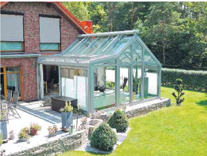
Ein Wintergarten verbindet Haus und Garten und sorgt für mehr Tageslicht im Haus.

Warum handwerkliche Kompetenz bei der Wintergartenplanung besonders wichtig ist