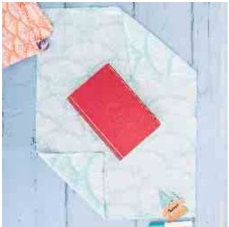
Schritt 2: Beide Seiten einklapfen, sodass die Ecken leicht versetzt voneinander am Geschenk liegen.