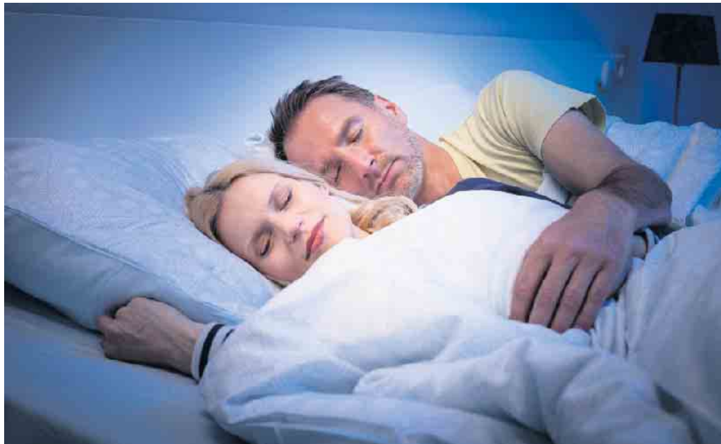
Doppelt ruhig schlafen: Intelligent vernetzte Systeme können heute nicht nur vor Einbrechern schützen, sondern auch smart den Energieverbrauch senken.

Energiesparkonzepte stehen heute an vorderster Stelle, wenn sich Haus- und Wohnungsbesitzer mit Themen rund um die intelligente Haussteuerung befassen. Fast gleichauf: Schutz und Sicherheit