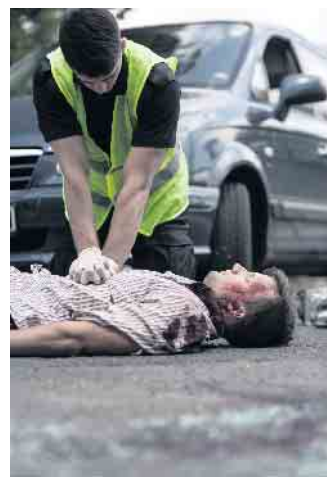
Eine wiederbelebende Herzdruckmassage haben „nur“ 54 Prozent der Autohalter in Deutschland nach eigener Einschätzung im Repertoire.

Unterschiede gibt es laut der AutoScout24-Umfrage auch zwischen den Geschlechtern: 21 Prozent der männlichen Befragten bringen bei Bedarf das komplette Maßnahmenpaket zur Anwendung, bei den Fahrerinnen sind es nur 15 Prozent. Vor allem wenn es darum geht, ein Opfer per Rettungsgriff zu bergen, sind Frauen zögerlicher: Während sich 50 Prozent der Männer diese Maßnahme zutrauen, sind es bei ihnen nur 29 Prozent. (djd)